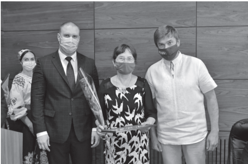
Урочистості з нагоди Дня медичного працівника у Полтавській облдержадміністрації.

У Полтавській облдержадміністрації відбулись урочистості з нагоди Дня медичного працівника. На зібранні голова Полтавської обласної ради Олександр Біленький та голова Полтавської обласної державної адміністрації Олег Синегубов відзначили кращих медиків області, зокрема вручили і премії Полтавської обласної ради імені М.В.Скляфосовського.