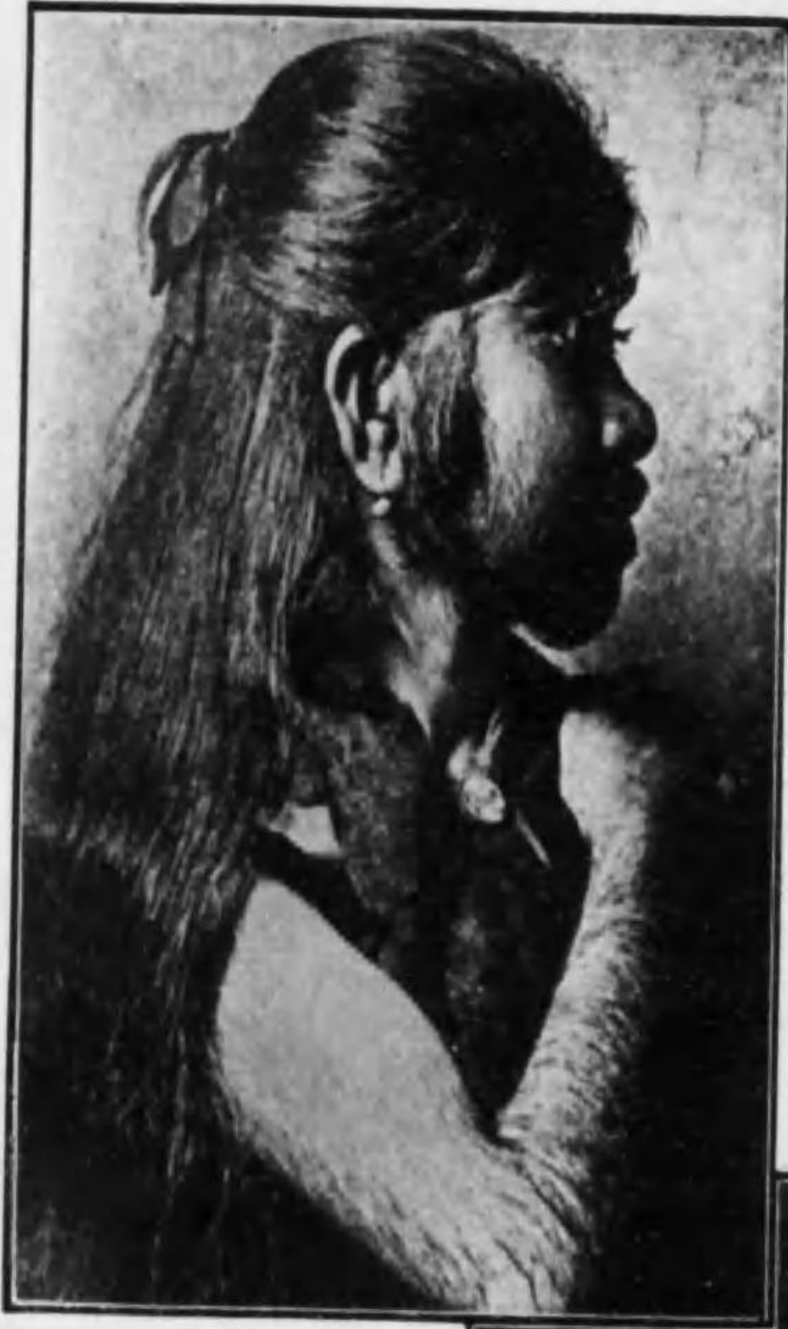
→ 二十六歳になる毛人の女