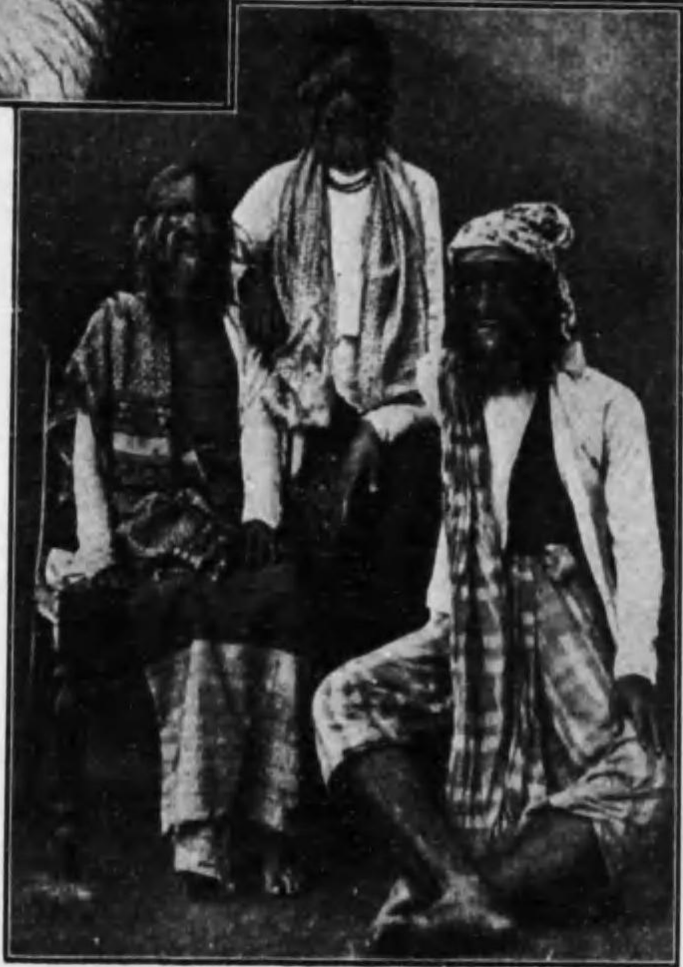
シウエーマオンといふ毛人の一家族 → 向つて左は女、向つて右の男の脛に注意 ↑ 額、頬、腕等ほとんど全身長毛密生せる毛娘