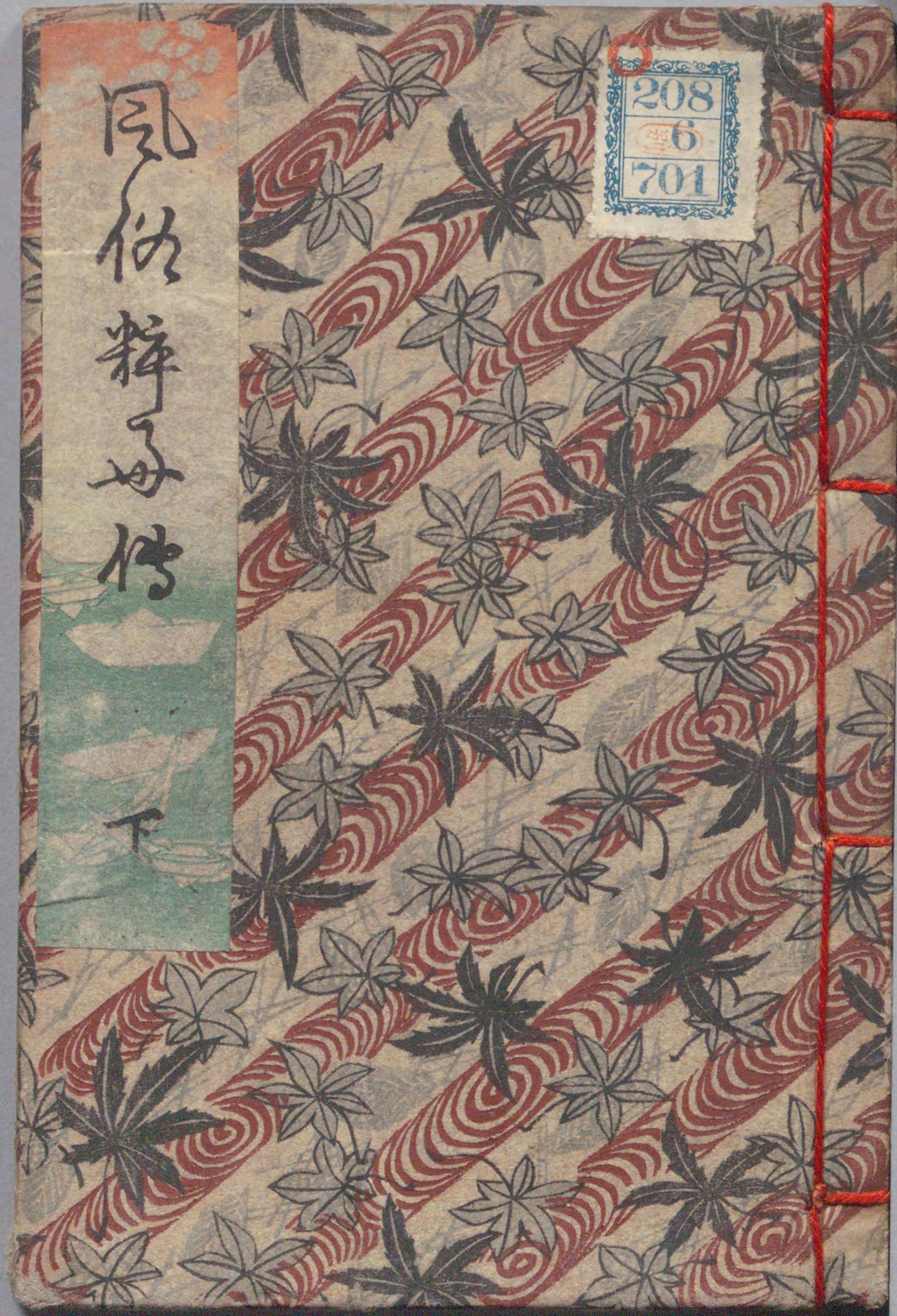
国立国会図書館 風俗粹好伝 2編 208-701