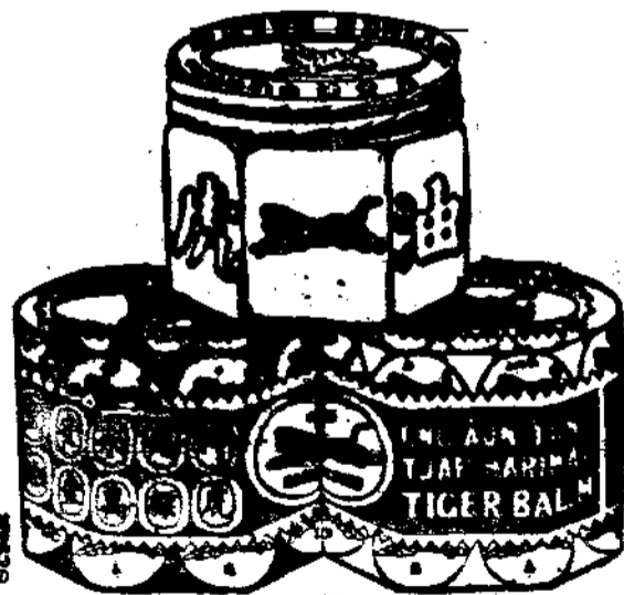
(印承司公刷印代時城吧)

虎標鮮艷人人識 品質精良世無敵 頭痛最好頭痛粉 靈藥有益而無損 心煩合用八卦丹 事務雖多也了閑 便閉且服清快水 消熱解毒功之魁 或服或擦萬金油 萬病霎時化烏有 記取仰光永安堂 藥賣全球姓名揚