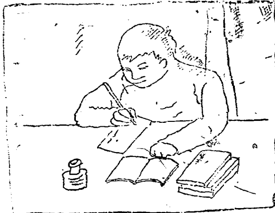
兒知自道己拙笨於功課特別上心

光陰過的飛快，一轉瞬間，這兩位小朋友，都脫離了兒童時期，而到了成人年齡了，當然要各找各的職業。小阿哥占着他祖宗的遺產