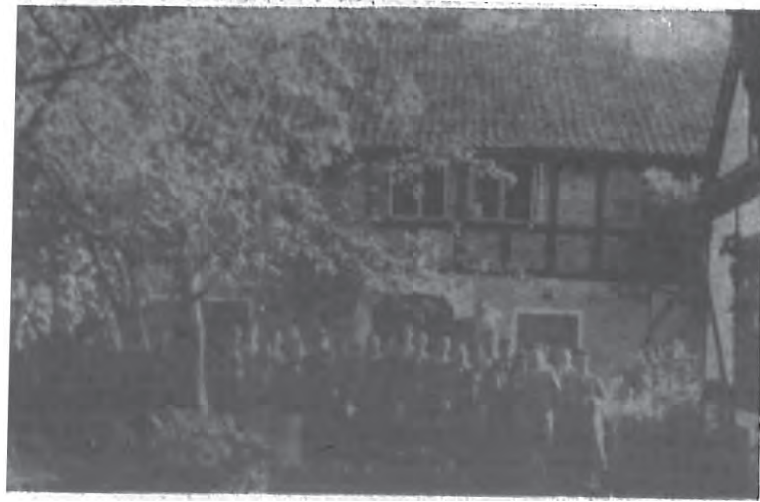
瑞奧操始祖林先生的故居