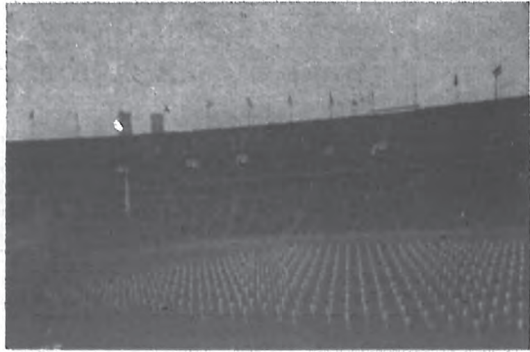
柏林世界運會中之團體操表演