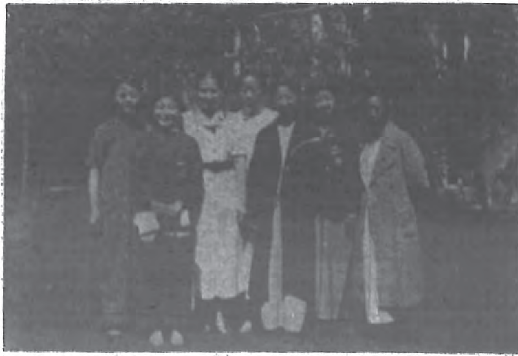
影留人夫克林萬與會總女婦國德在