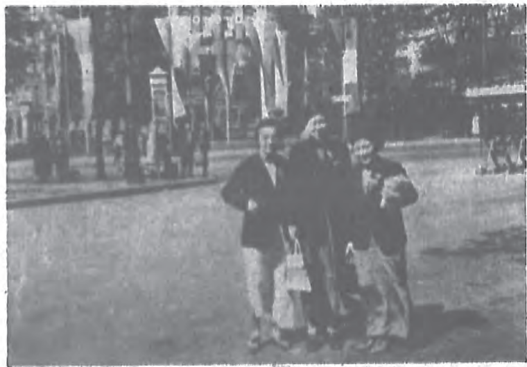
世界運會中之柏林街市