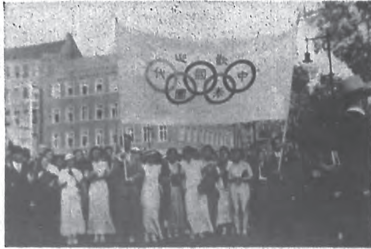
團表代國中迎歡站車林柏在胞僑歐旅