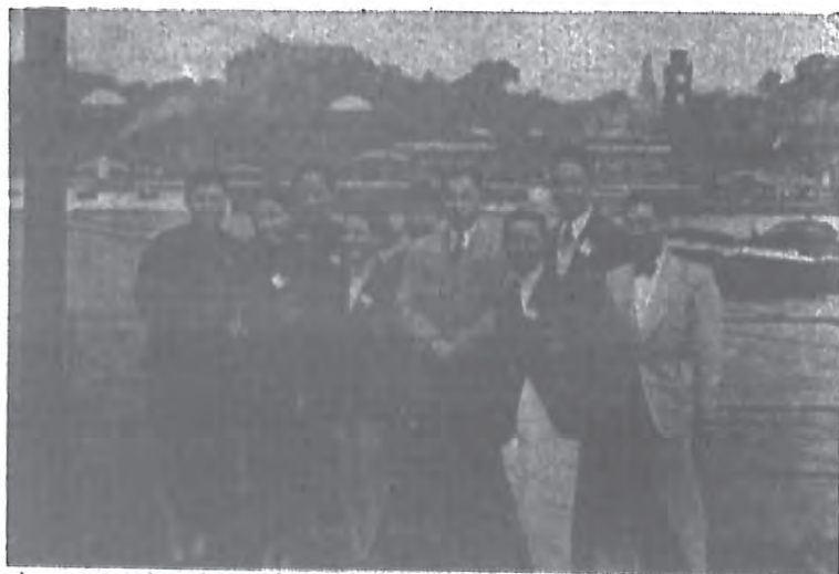
考察團參觀漢堡河底隧道時留影