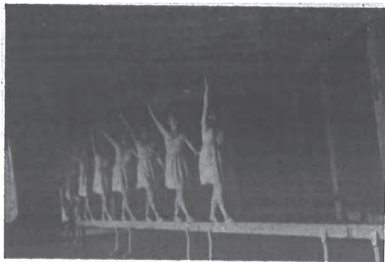
木均平走子女麥丹