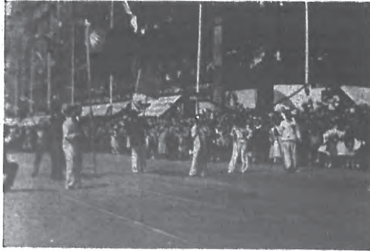
中華國術團參加漢堡國際遊行大會時馬路上表演之情形