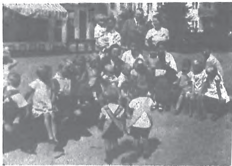
園稚幼林柏所一之觀參所們我