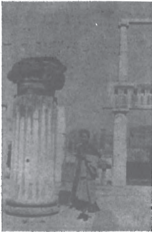
作者在意大利庞培古城