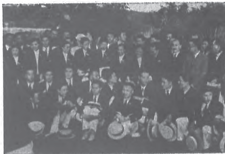
會大迎歡僑華歐旅之林柏於攝團表代華中