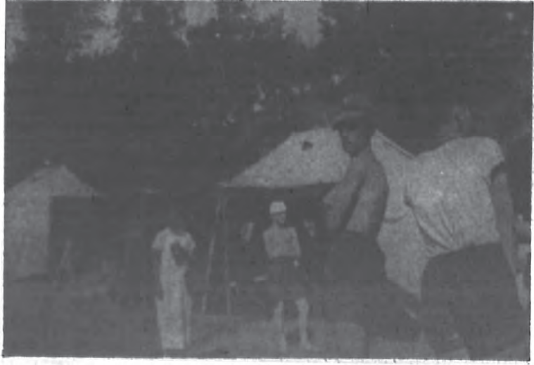
个意大利之巴里拉少年营