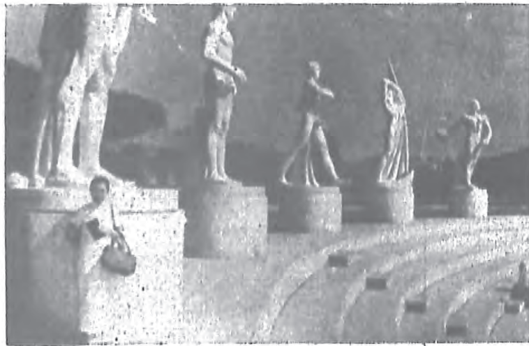
(築建石理大全完用刻彫及台看)場動運尼里索墨