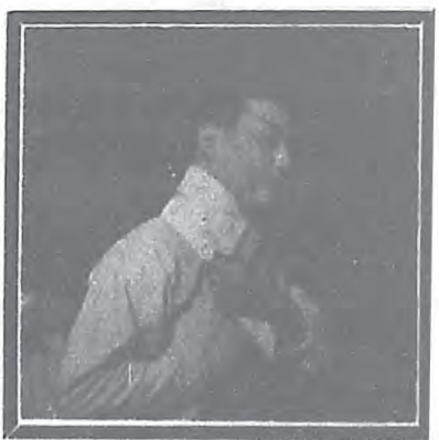
周信芳君便裝及化妝小影