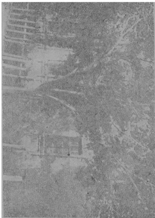
○ 勇仕的依沃射高，格列奧