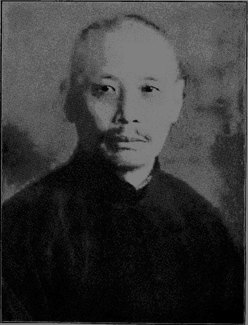
居 院 長