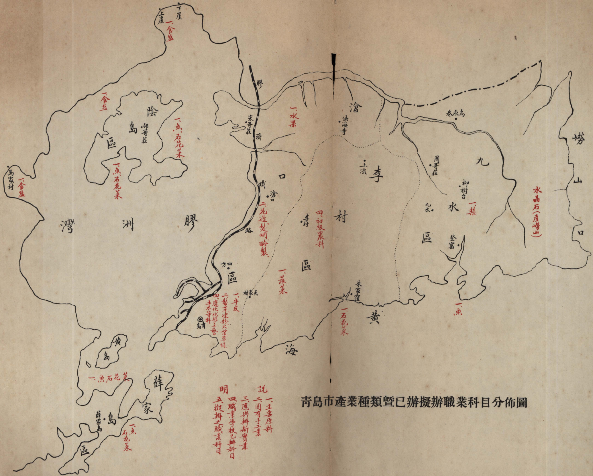
青島市產業種類暨已辦擬辦職業科目分佈圖