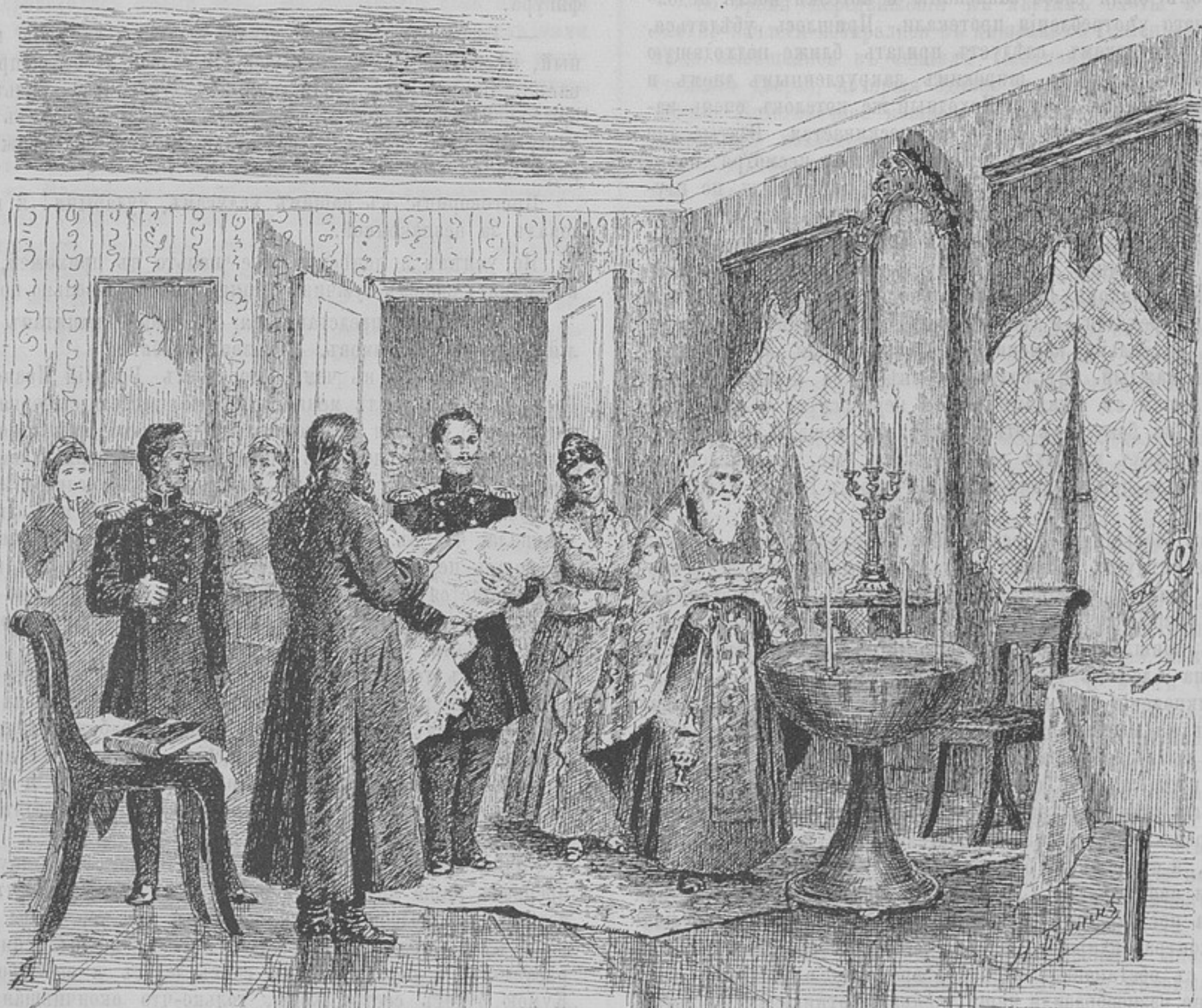
Къ разсказу «Крестникъ».

Разъ какъ-то на долю командуемой мною роты выпала очередь идти на ночную траншейную работу; требовалась послѣдняя постройка батарей для нашей артиллерійской бри-