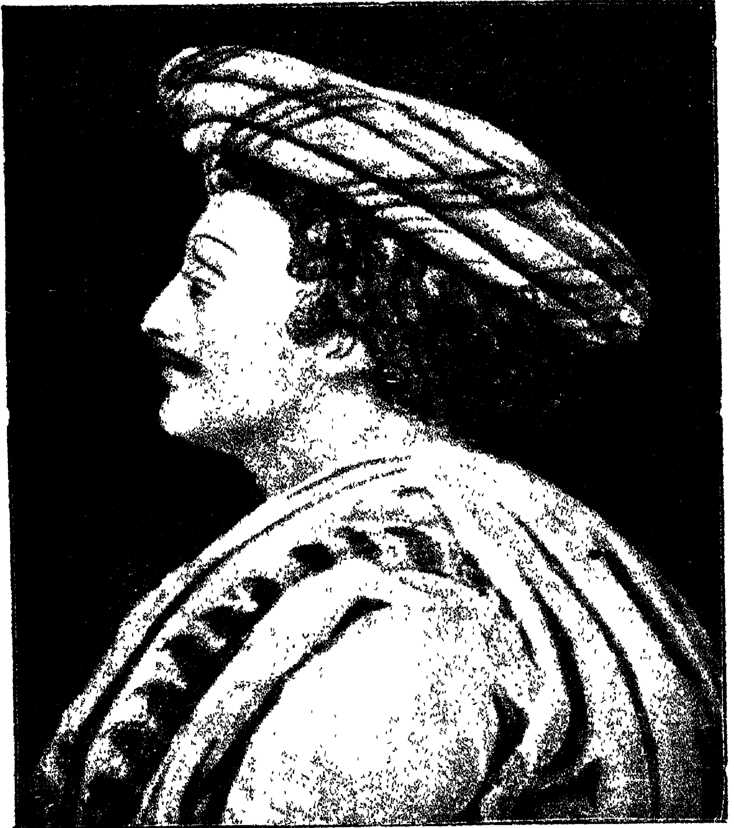
রাজা রামমোহন রায় ।