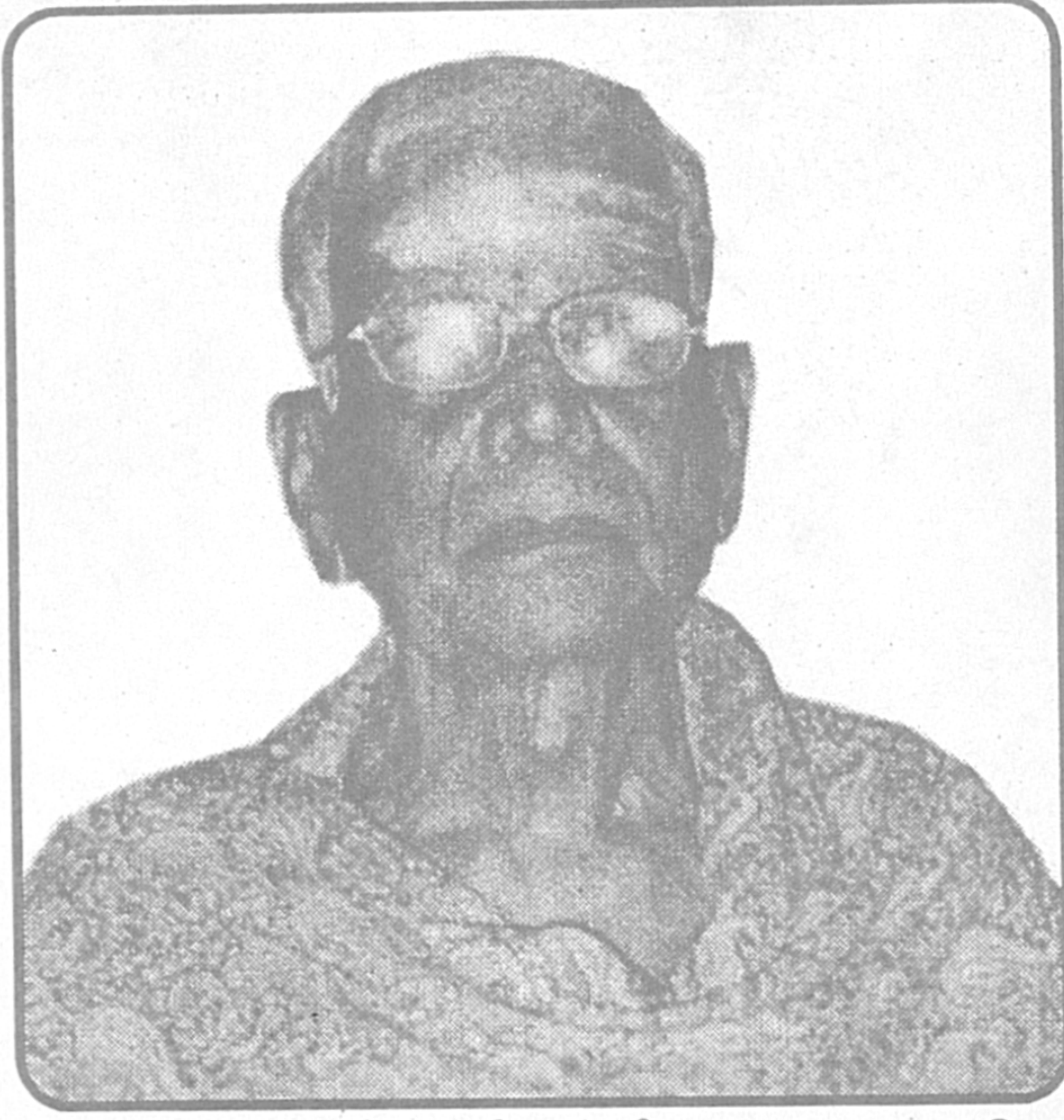
தீருமூலரின் முத்தமிழ் ஷேத சூதாசிரியர் பேராசிரியர் தீருஅடிகளாசிரியர்