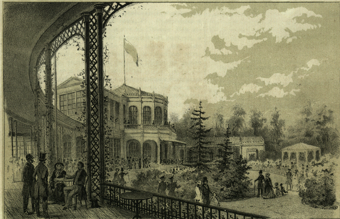
Воксаль оъ Павловскомъ Паркѣ.