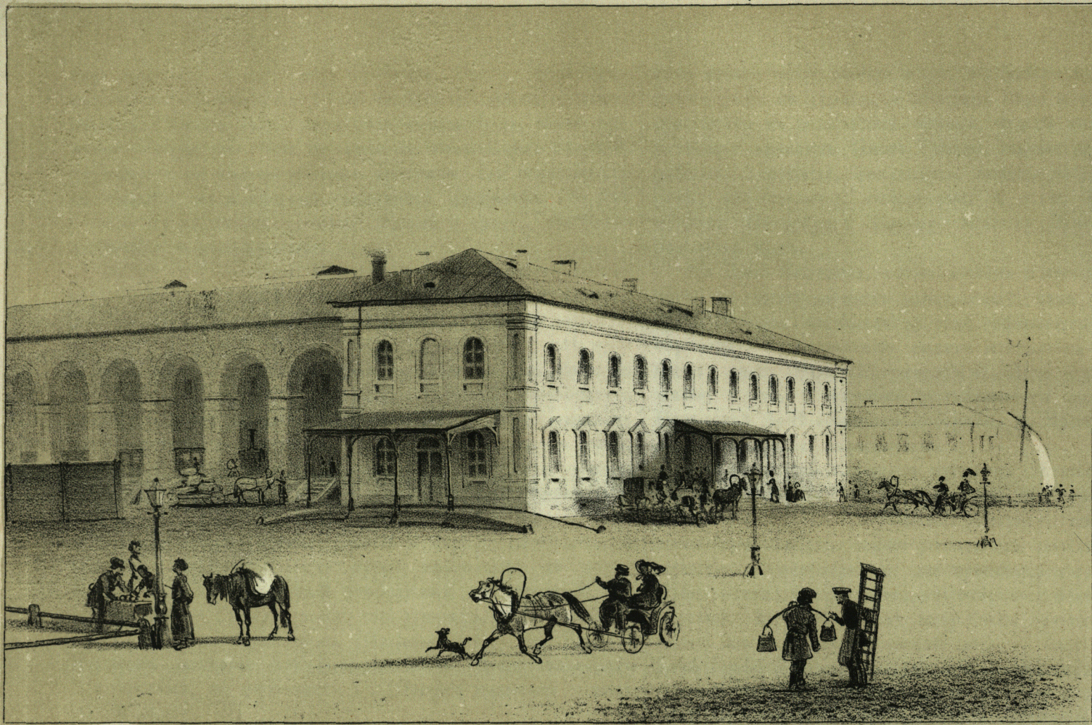
Станція Царскосельской Жельзной Дороги, въ С. Петербургъ