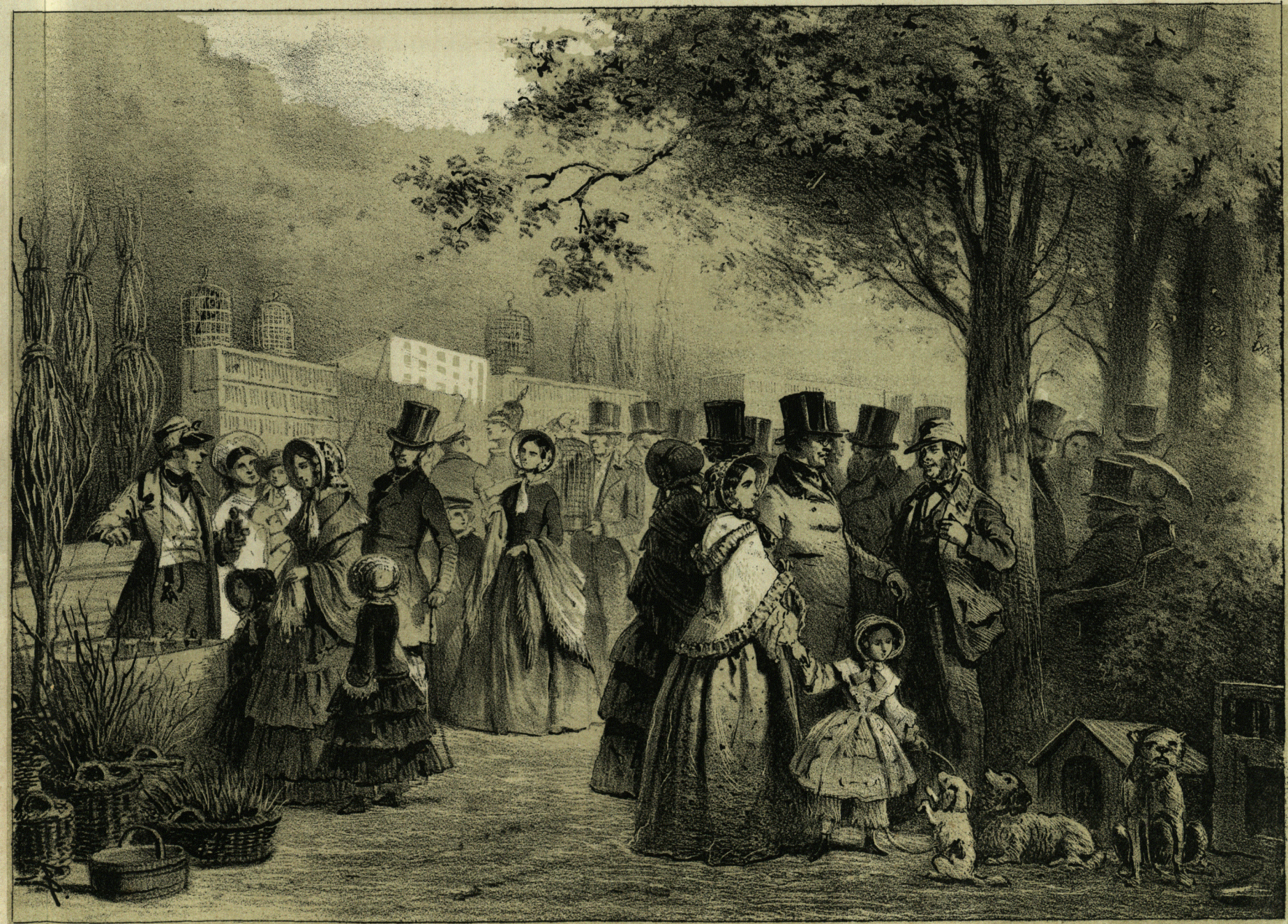
Продажа животныхъ и растеній на Биржевомъ Скверѣ.