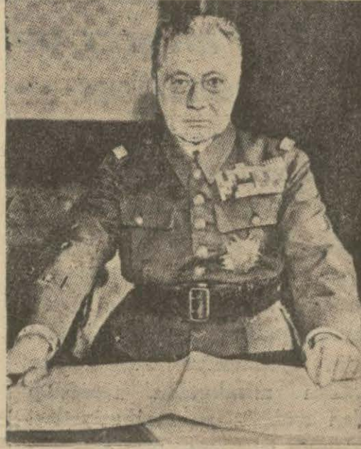
Fransız büyük erkânıharbiye reisi General Gamelin