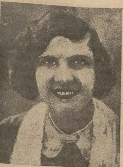
İkinci karısı Lita Grey

Buna sebep Şarlonun bundan evvel iki izdivacında büyük felâketlere uğraması, ayrıldığı karılarına tazminat olarak milyonlar vermeğe mecbur kalmasıdır. Şarlo o zamanlar gençti, çok derin düşünmeğe lüzum görmüyordu. Şimdi yaşı elliye yaklaşmış, saçları kâmilan ağarmıştır. Filim çevirirken beyaz saçlı görünmemek için bunları boyamağa mecbur oluyor. Fakat herkes arasında ak saçlarla gezmektedir. Şarlo yarım asırlık tecrübeye istinad ederek şimdi hiç birşeyde acele etmek istemiyor.