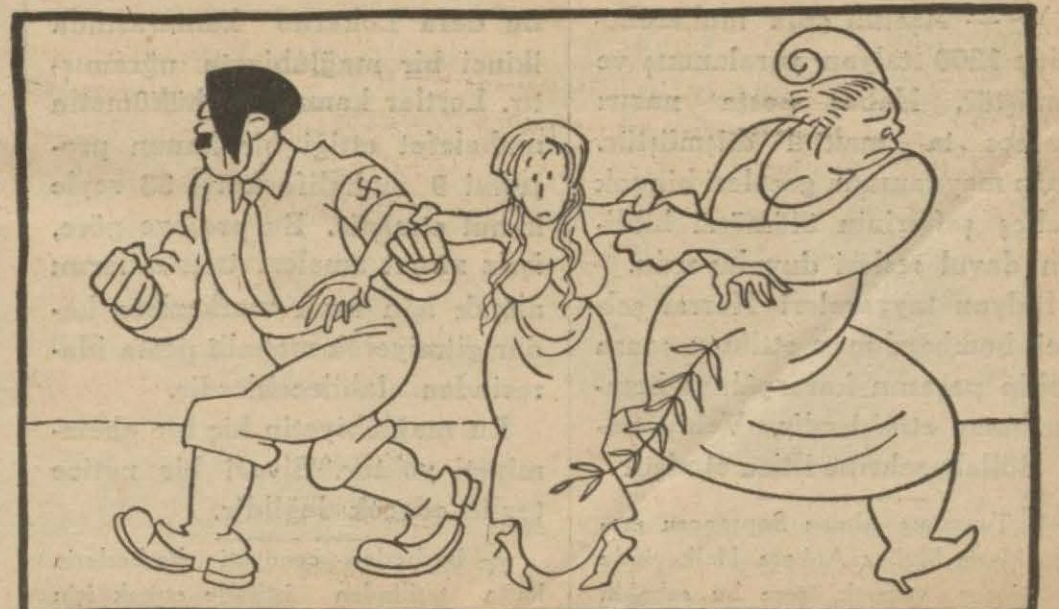
Avrupada sulh davası!...