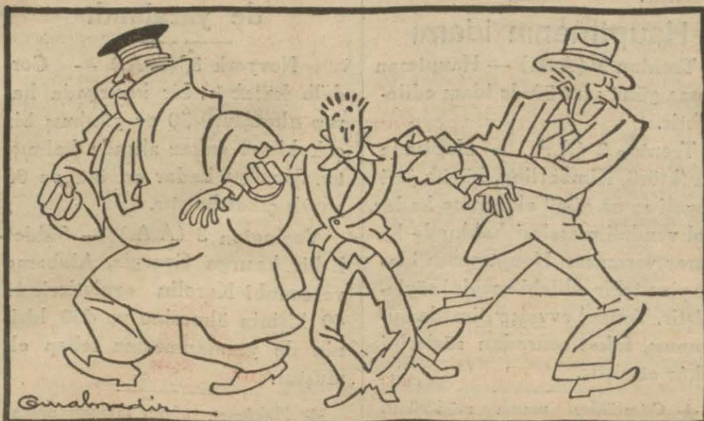
Amerikada Hauptman davası!...