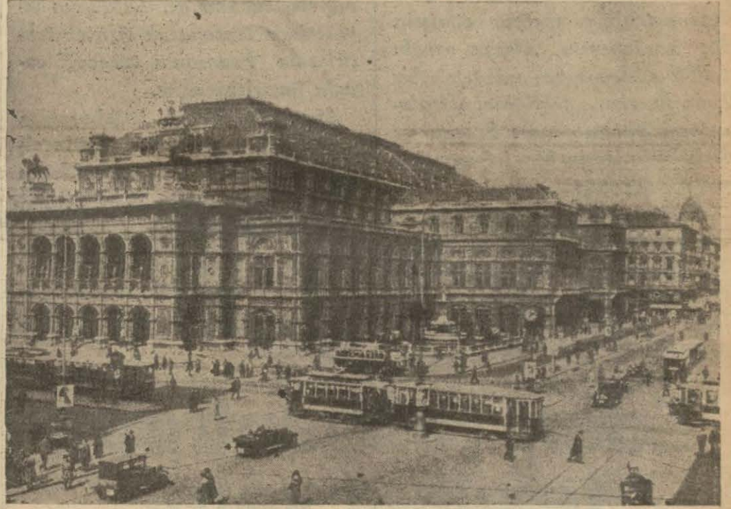
Viyanadan bir görünüş: Opera meydanı

Küçük itilâf devletleri aralarında görüşerek Avusturyayı protesto edecekler