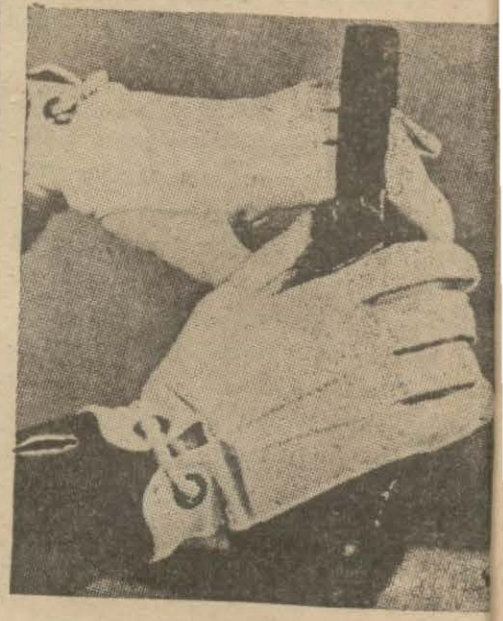
Otomobil ve sabah gezintileri için kullanılan eldivenlerin yeni bir modeli. El üzerinde iki madeni yuvaraktan bir kordon geçmektedir. Bu eldivenler beyaz, sarı, lacivert renklerde giyiliyor.