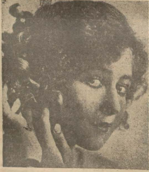
Şarlonun ilk karısı Mildred Harris.

İlk iki izdivacında uğradığı felâketler yüzünden şimdi bir türlü evlenmeğe karar veremiyor