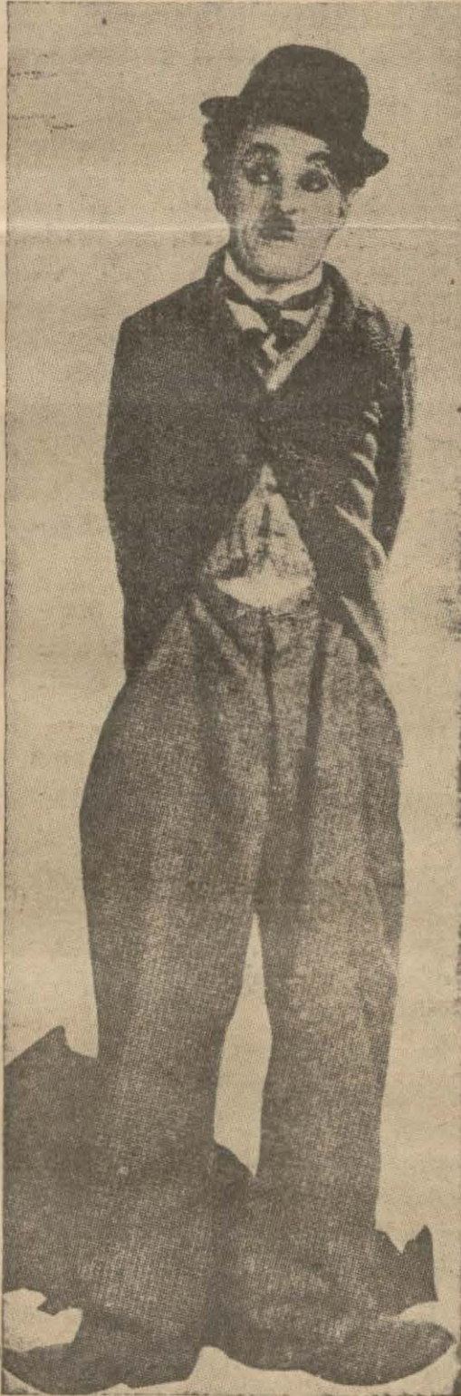
Yeni nişanlısı Paulette Goddard

Şarlo sinema artisti olmadan Londrada seyyar bir tiyatro kumpanyasında çalışırdı. O zamanlar yarı aç, yarı tok bir halde yeşardı. İşte bu sıralarda, henüz 21, 22 yaşında iken bir genç kıza çılgınca sevmişti. Fakat karmını doyurabilmeğe için seyyar tiyatro kumpanyasına Amerikaya gitmeğe mecbur olmuş, orada uzun müdet kalmıştı. Şarlo filim çevirmeğe başladuktan ve beş on para kazandıktan sonra bu genç kıza bulmak için çok çalışmıştır. Fakat sevgilisini bir türlü ele geçirememiştir.