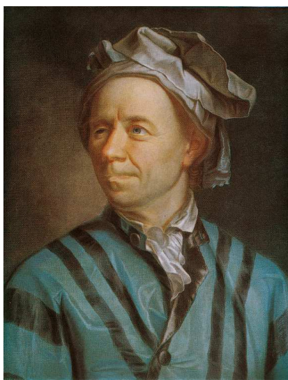
Leonhard Euler (1707-1783)

und konvergieren somit gegen 0. Also liegt insgesamt eine Intervallschachtelung vor. \square