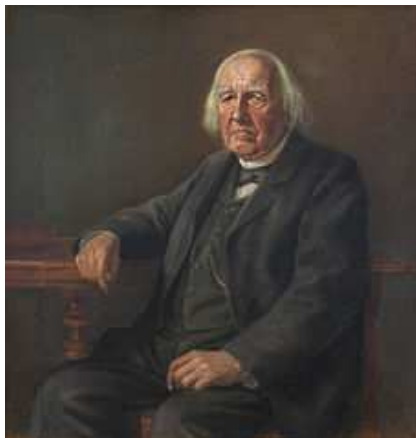
Karl Weierstraß (1815-1897)

Die folgende Aussage heißt Satz von Bolzano-Weierstraß .