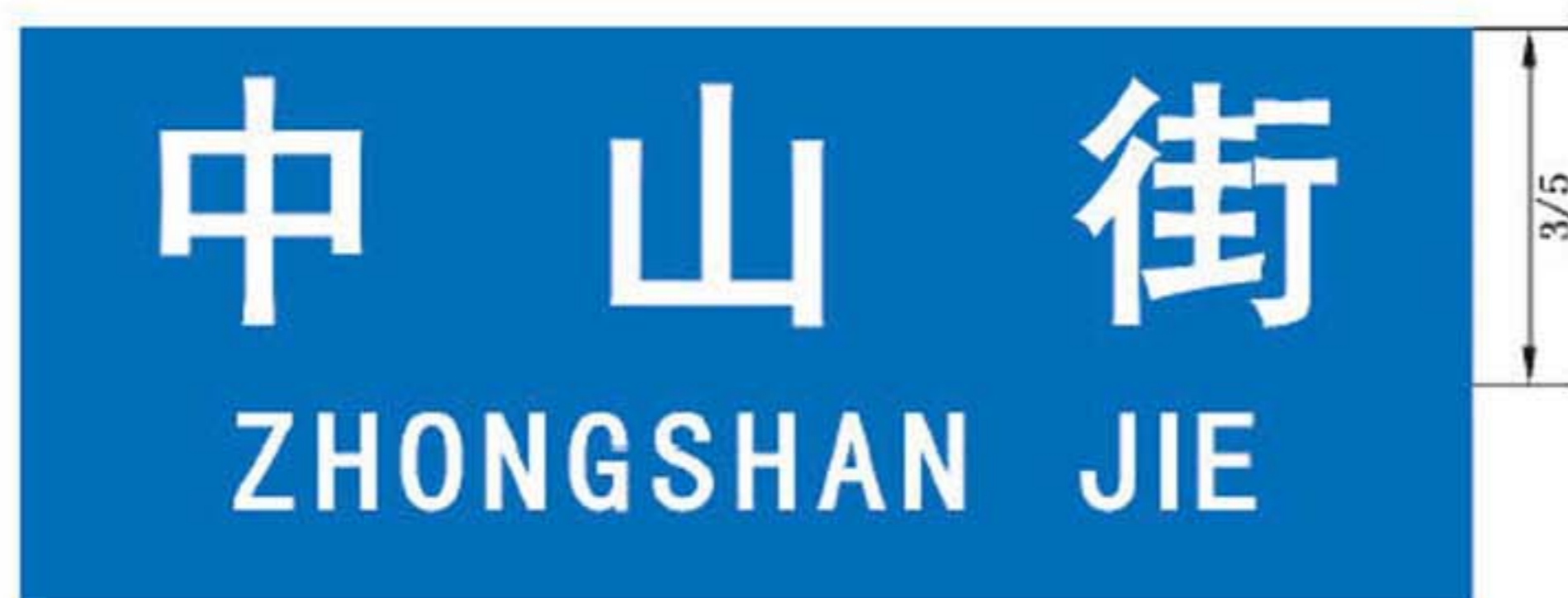
图 B.11 街地名标志版面示例