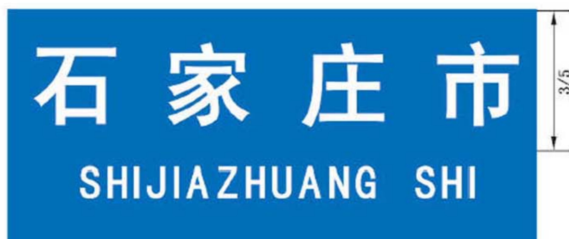
图 B.5 地级地名标志版面示例