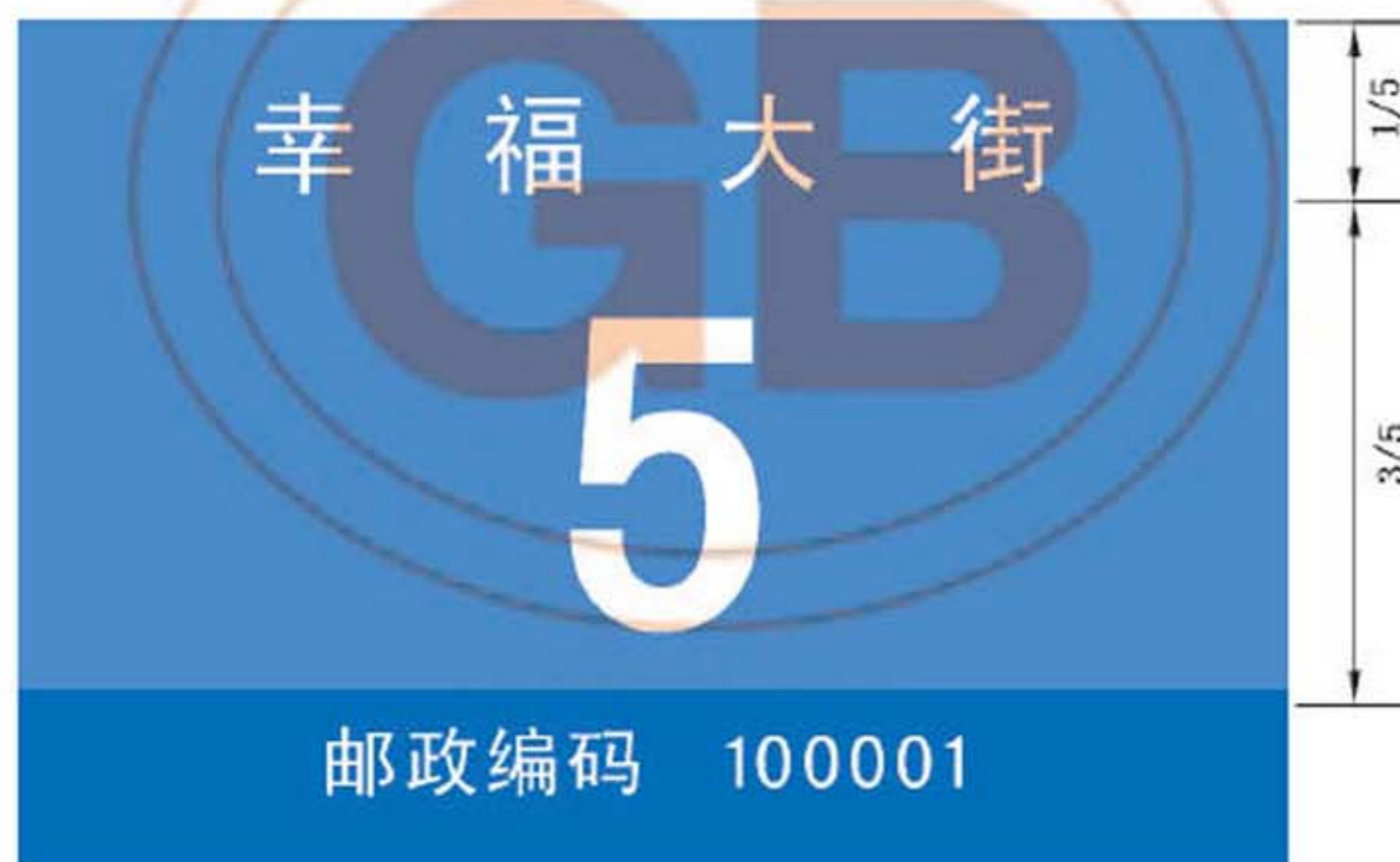
图 B.24 带有邮政编码的地名标志版面示例