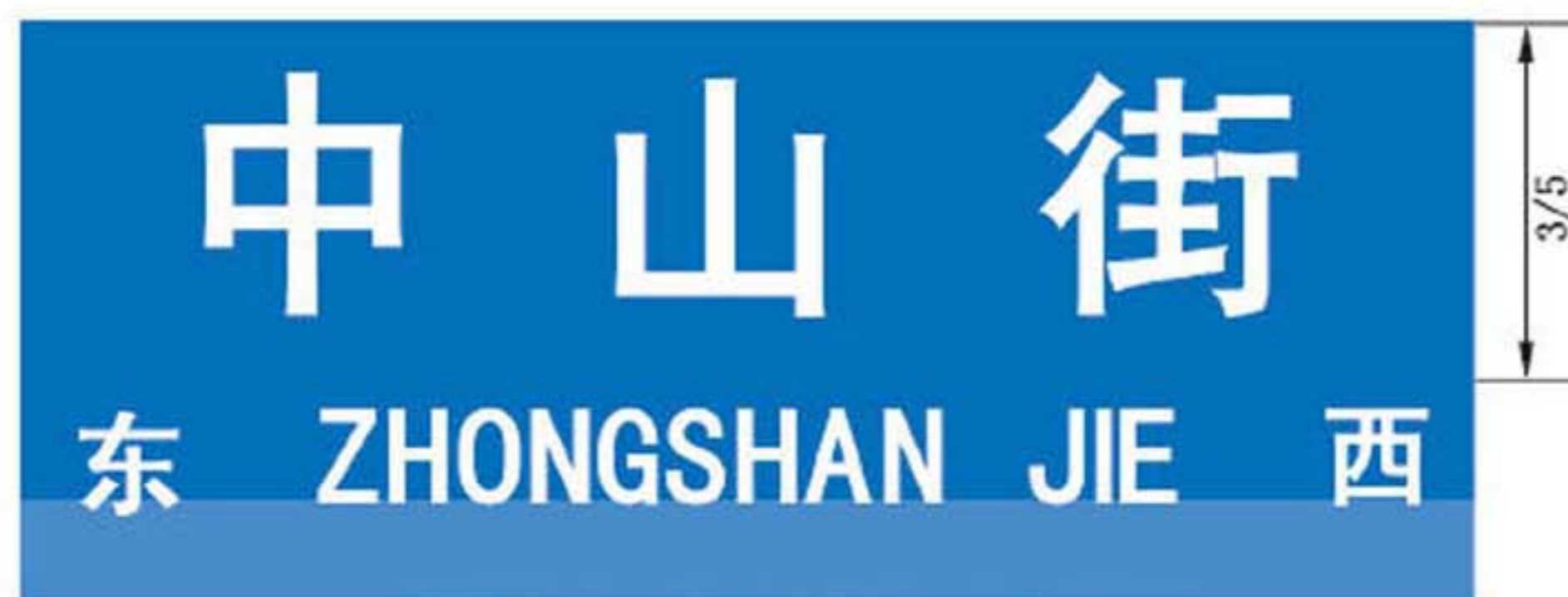
图 B.23 带有指示方向信息的地名标志版面示例