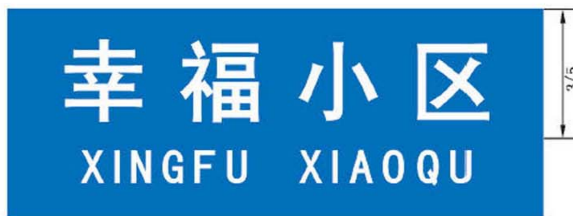
图 B.14 小区地名标志版面示例