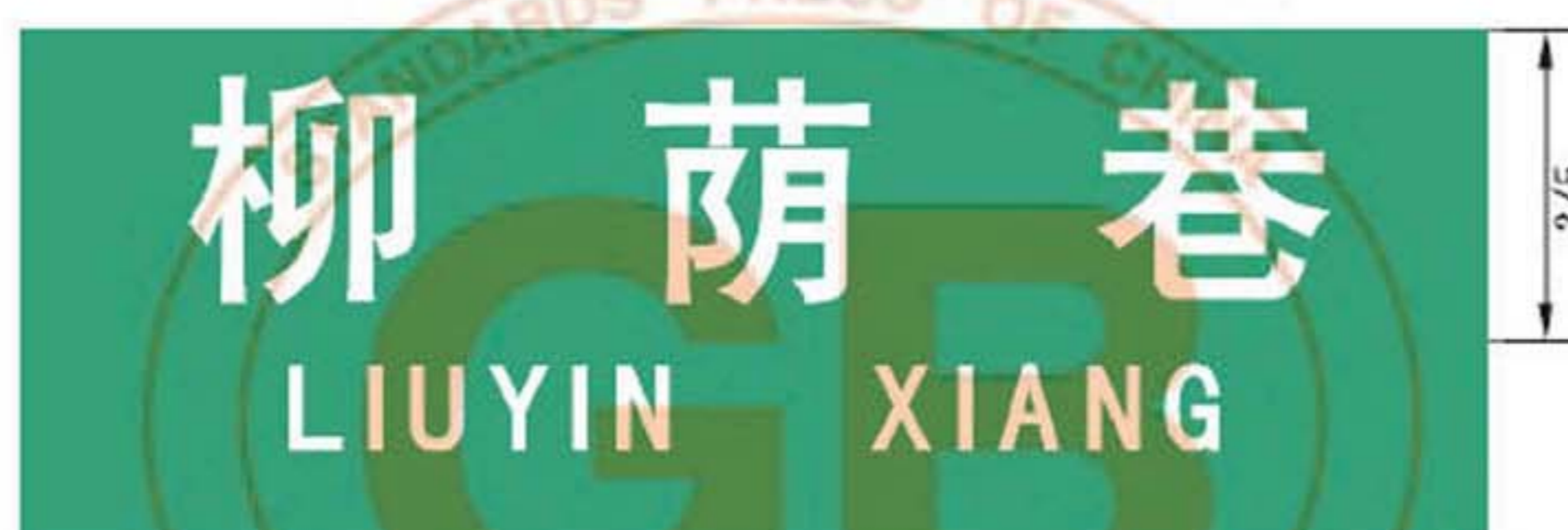
图 B.12 巷地名标志版面示例