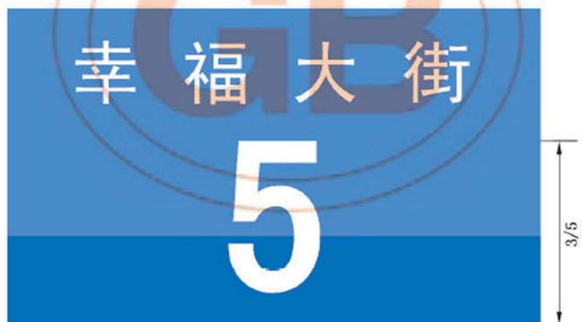
图 B.17 门地名标志版面示例