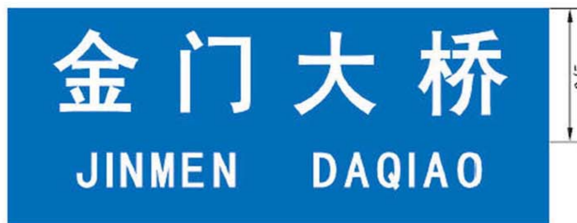
图 B.9 设施地名标志版面示例