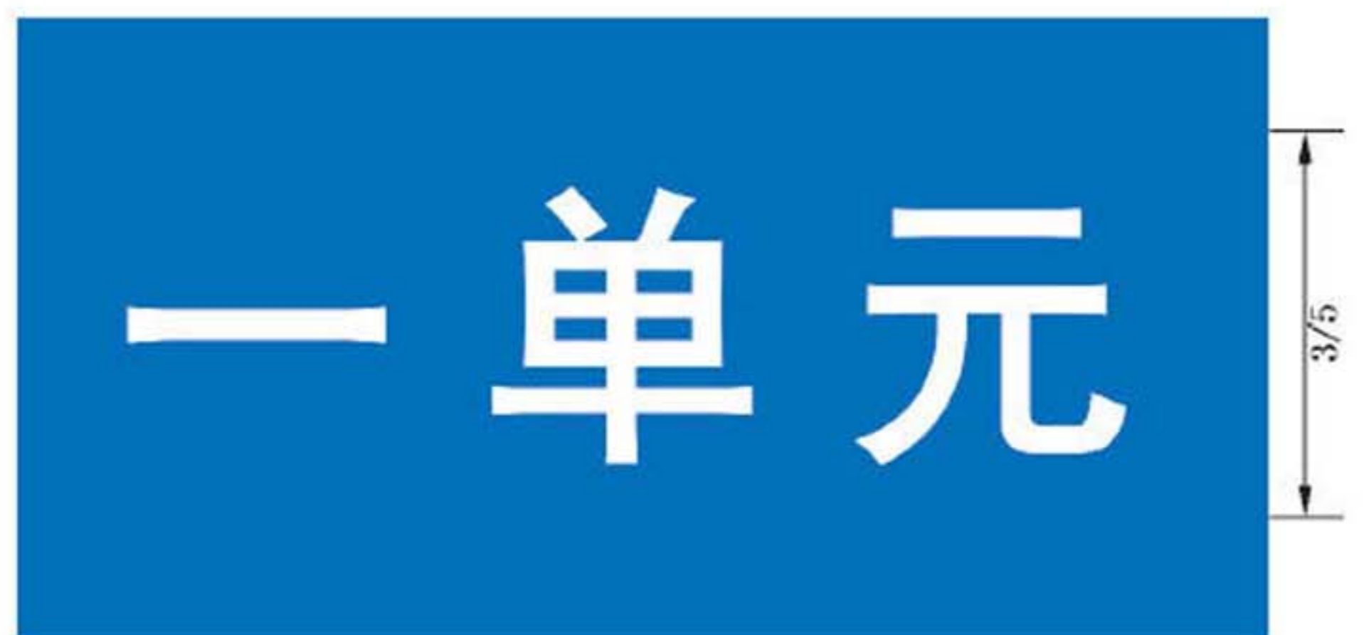
图 B.18 楼单元地名标志版面示例