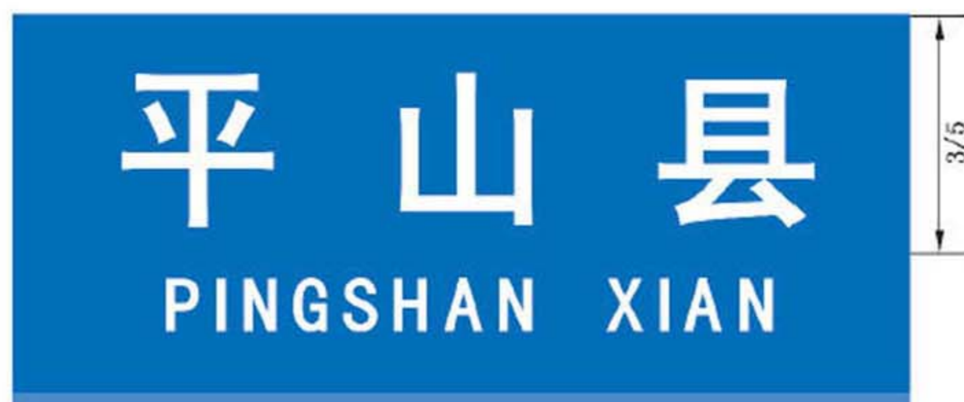
图 B.6 县级地名标志版面示例