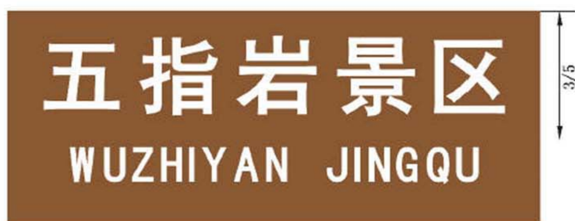
图 B.10 纪念地和旅游地地名标志版面示例