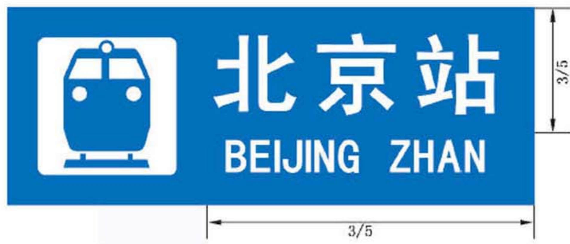
图 B.22 带有图形符号的地名标志版面示例