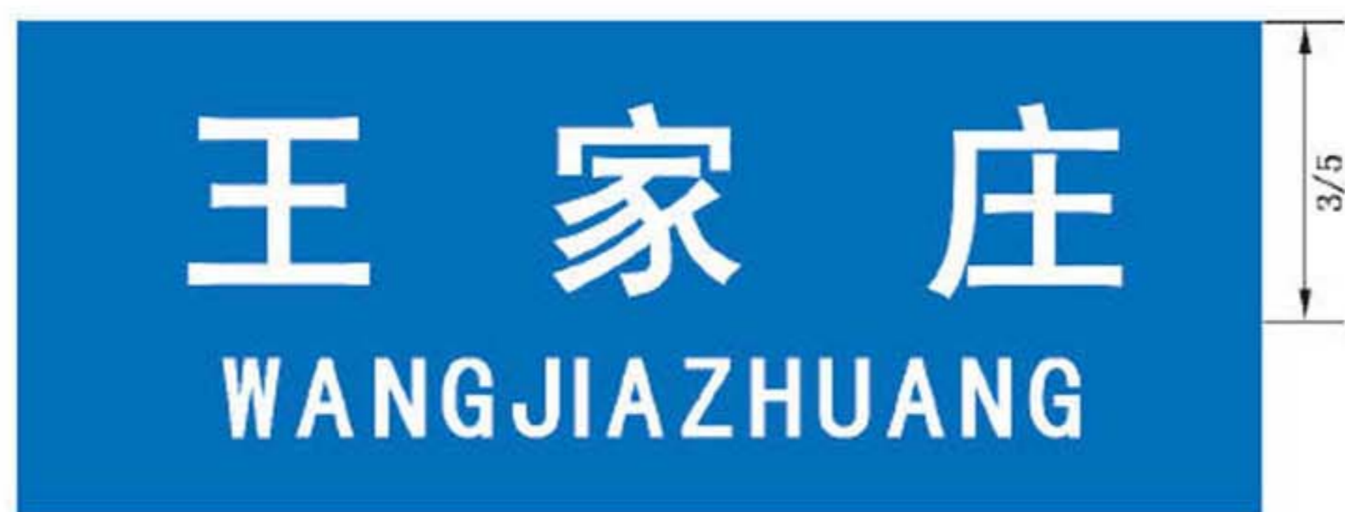
图 B.15 村地名标志版面示例