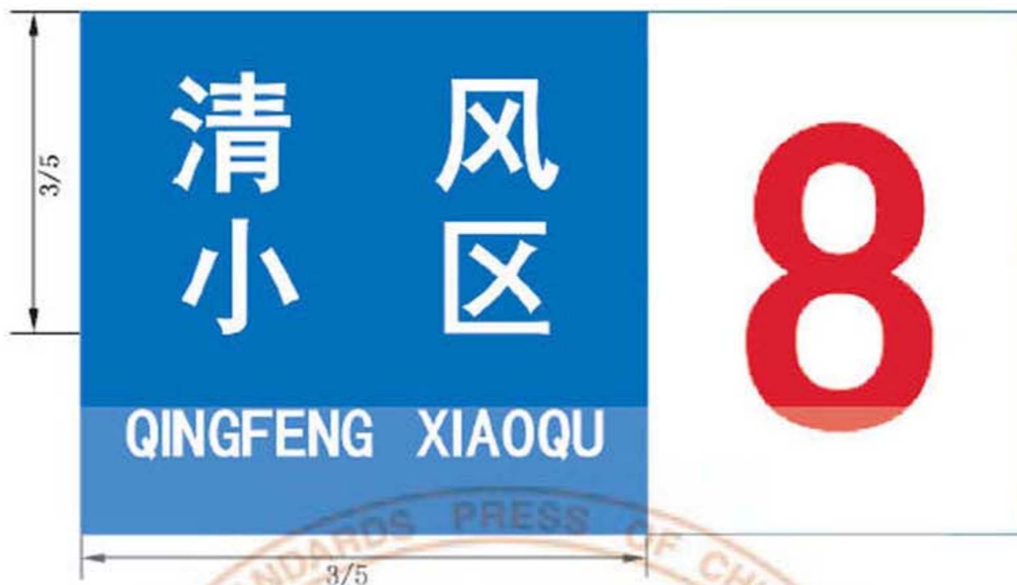
图 B.16 楼地名标志版面示例