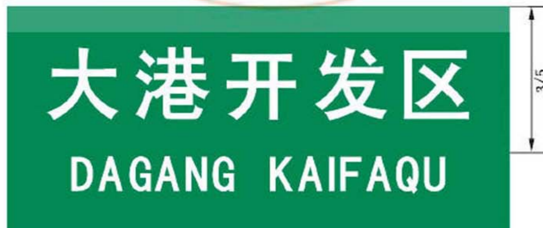
图 B.8 专业区地名标志版面示例