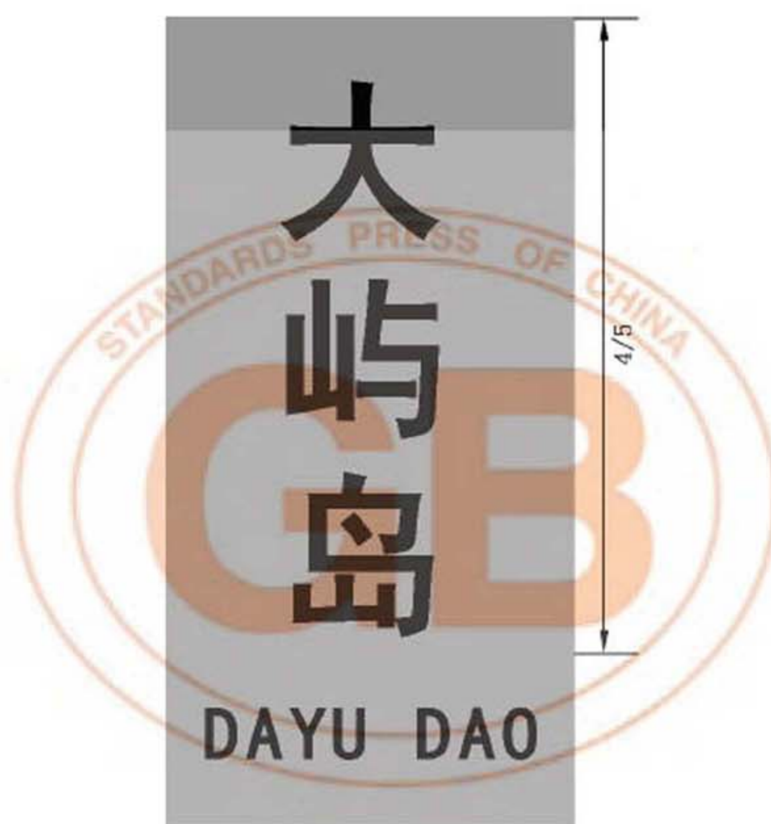
图 B.20 竖置的碑碣式地名标志版面示例