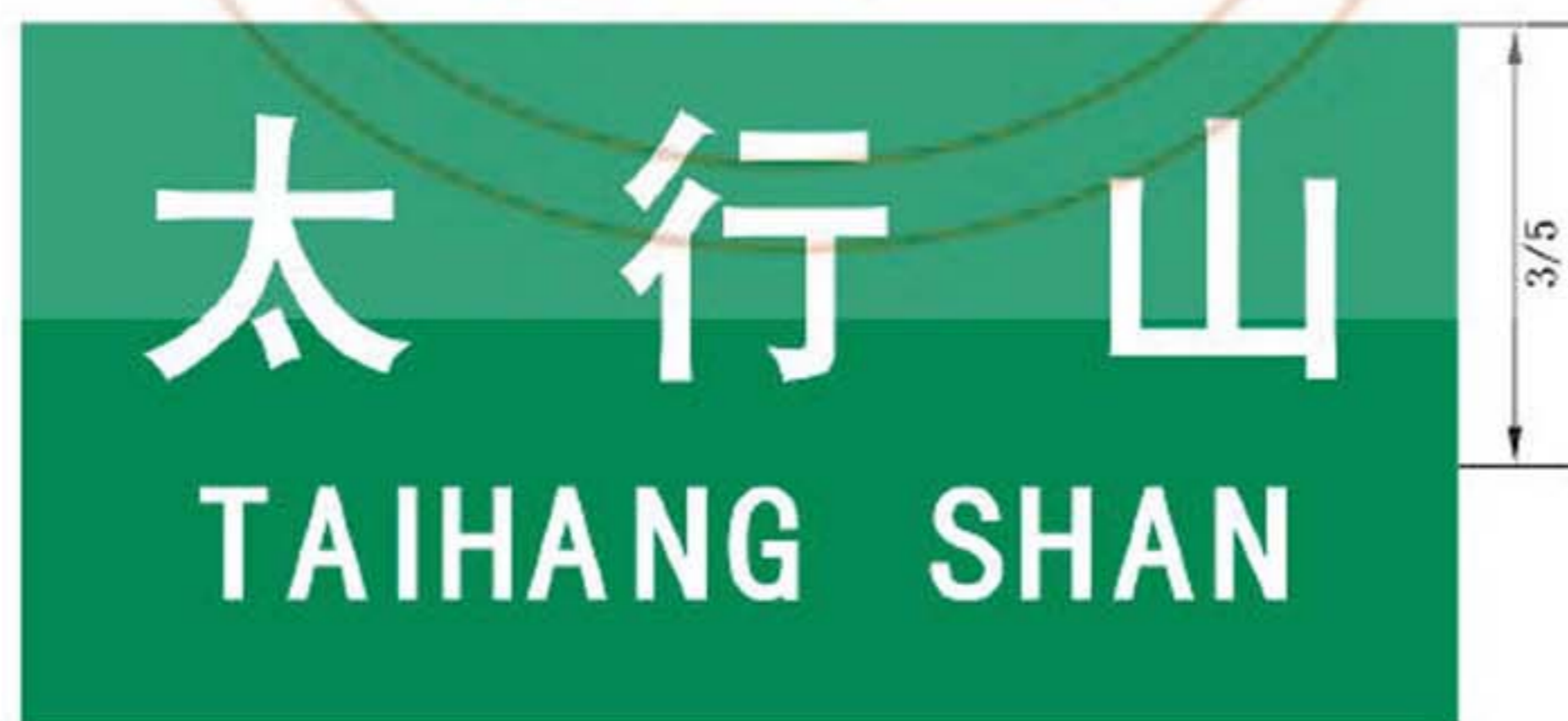
图 B.3 地形地名标志版面示例