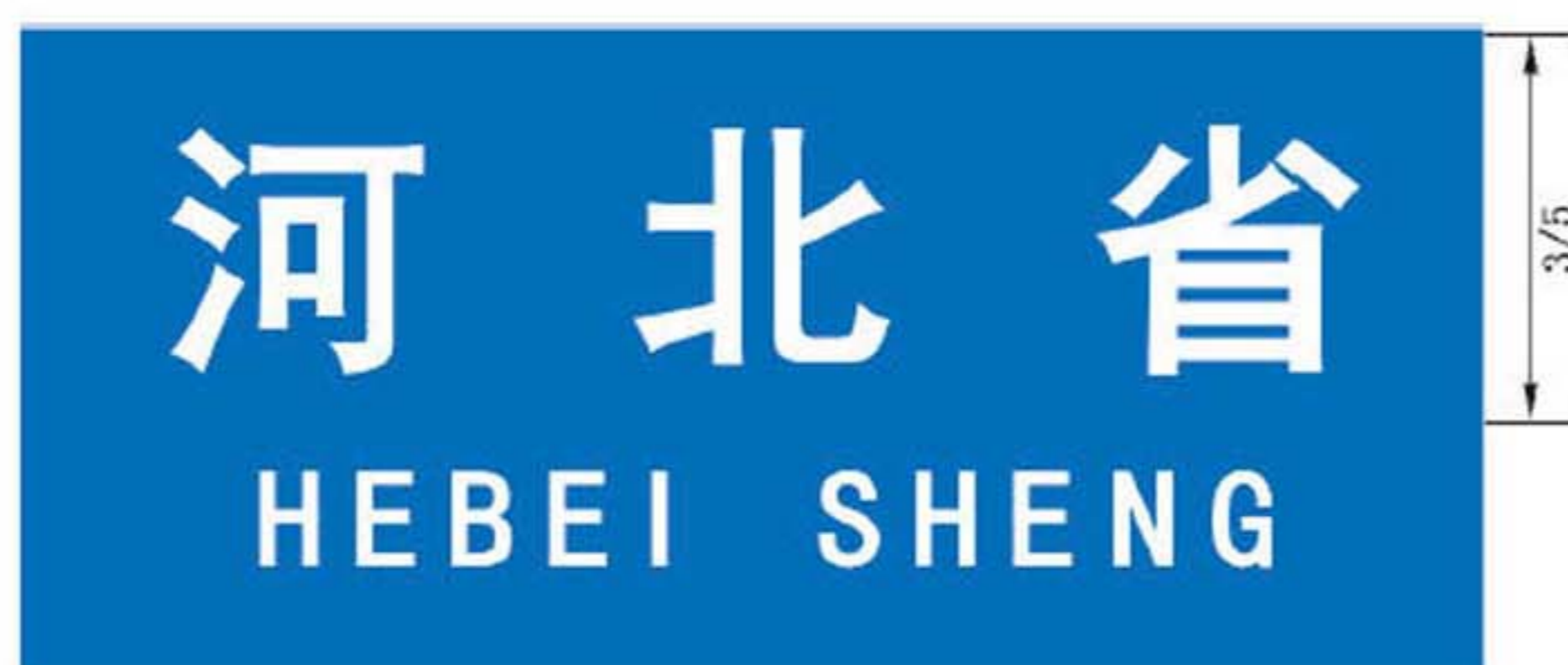
图 B.4 省级地名标志版面示例