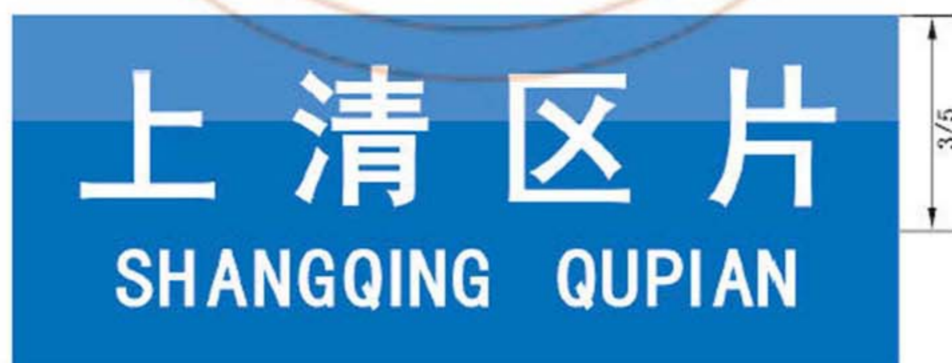
图 B.13 区片地名标志版面示例