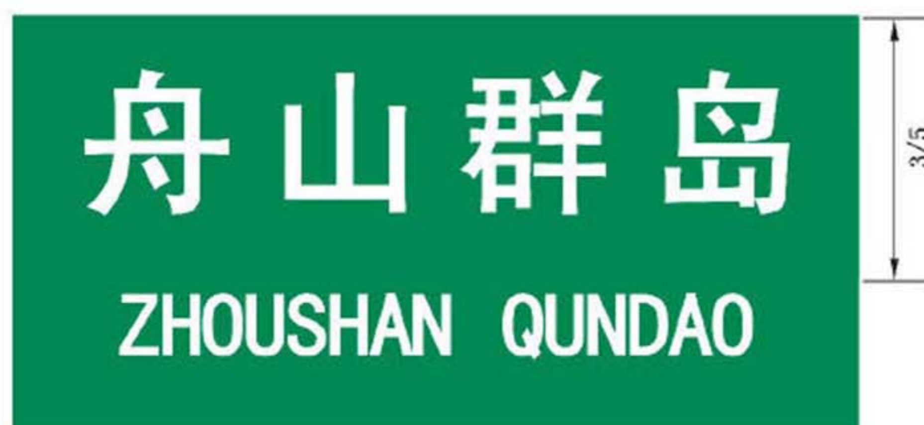
图 B.1 海域地名标志版面示例