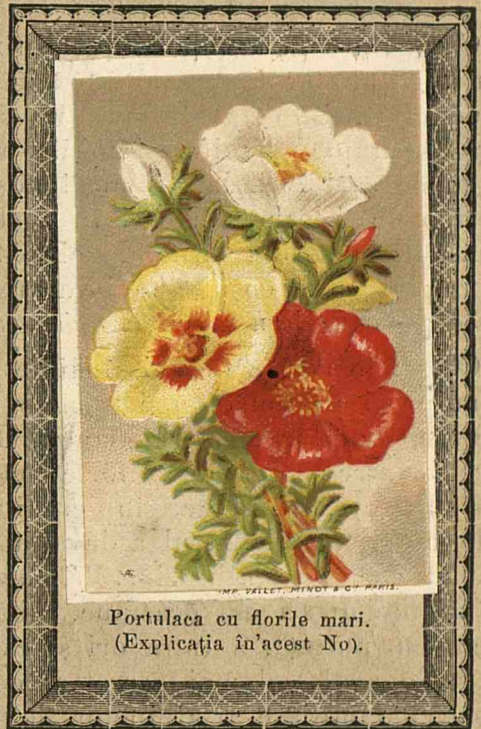
Portulaca cu florile mari. (Explicația în'acést No).

De aceea, noi credem că ar fi de mii de ori mai bine — atât pentru punga bărbatu- lui și fericirea familiei, cât și pentru mora- lul și fisicul copiilor — ca, când o mumă are odrasle să ia frênele creșcerei lor în mâinele sale; căci o mamă bună face cât o sută de guvernante. Iar aceea care nu pôte, să 'și alégă o reprezentantă dintre educătó- rele nóstre și să nu mai dea preferința celor streine; căci gândul acestora e pe malurile Rinului ori ale Vienei iar nu la modul prin care ar putea creșce cu succes pe copii ce 'i guvernază.