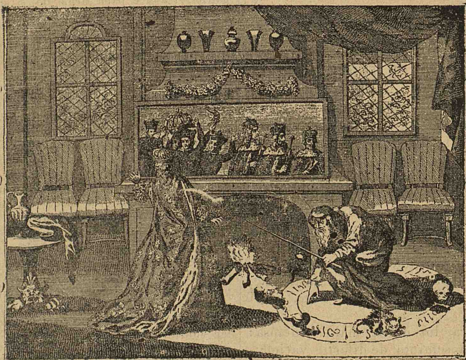
Uă prevestire a lui Nostradamus. (A se vedea articolul „Oglindele magice“ din viitorul No).