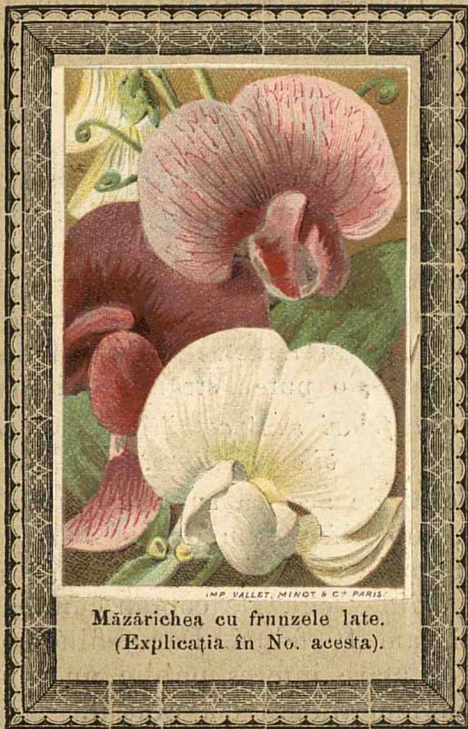
Măzărîchea cu frunzele late. (Explicația în No. acesta).

»Mamele Țice un tînăr român, la noi nu să prea îngrijesc de buna educațiune a co- piilor, ci din contra 'i lasă pe mâna guver- nantelor și servitôrelor. Vițiurile cele mai detestabile li se infiltră micilor copilași, iar influența lor asupra vieței următore e forțe mare. Mărturisească pedagogii noștri și în genere toți institutorii, dacă acésta nu e a- devêrat.....«