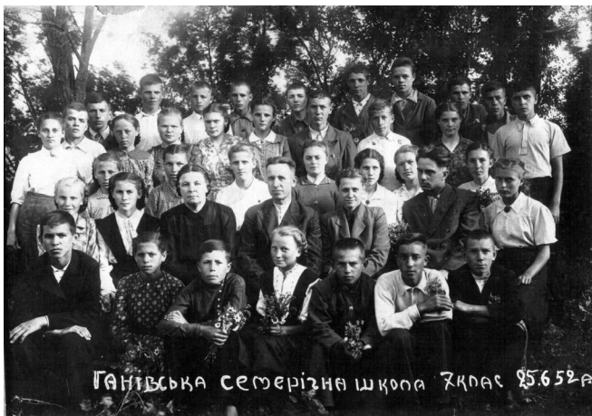
Ганівська семінарська школа 1926 року