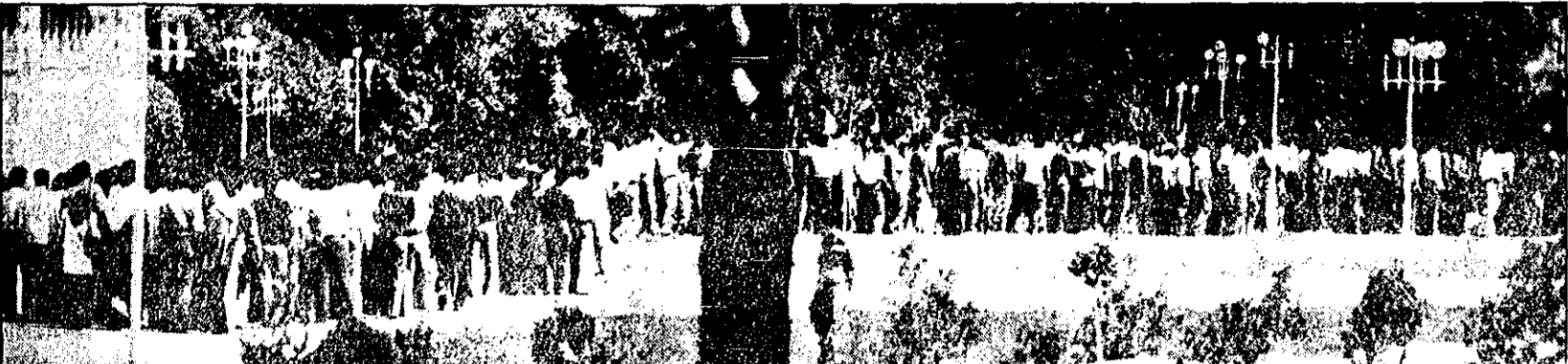
دانشجویان دانشگاه آذرآبادگان روز گذشته طی اجتماع در محوطه دانشگاه خواستهای خود را مطرح کردند. عکس گوشه ای از تظاهرات دانشجویان را نشان میدهد. صفحه ۲ - ستون سوم

تظاهرات در تهران، اصفهان، شیراز، ارسنجان، کرمانشاه، قزوین، اردبیل، اراک و اهواز و قم انجام شد