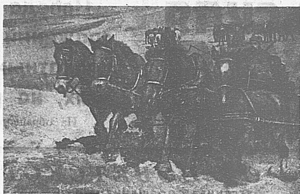
3. Танка идет в бой