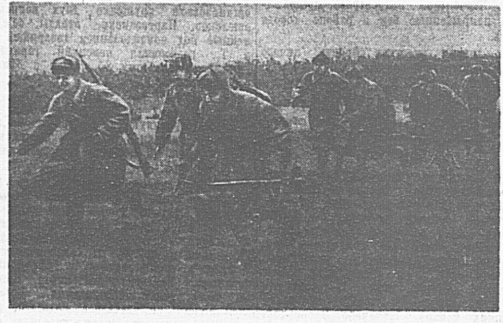
4. Советские стрелки из противотанковых ружей под командованием младшего лейтенанта комсомольца Павла ИКАЕВА выходят на огневую позицию.