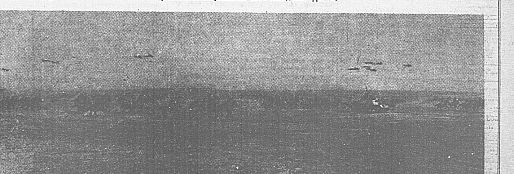
2. Безудержной лавиной мчатся на прага наши смелые колонны, поддерживаемые танками и авиацией. Немецкая пехота не выдерживает этих стремительных ударов.