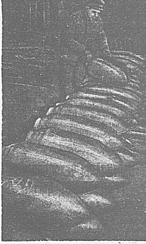
Вслед за металлургами и строителями танков и самолетов во всеобщее соревнование включаются работники все новых отраслей промышленности. На снимке: на Н-ском заводе готовят корпус для авиамотора; эти бомбы обрушатся на головы немецко-фашистских оккупантов.