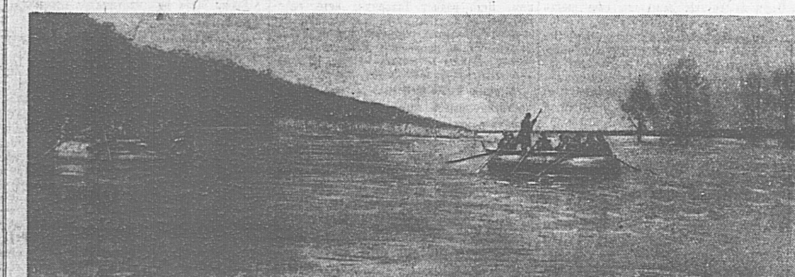
1. Широко разлилась полноводная река, которую пришлось форсировать нашим смелым войскам. Передовые подразделения переправлялись через нее на понтонах.

Здесь день и ночь гремит пушки, грохочут танки, поют победную песнь красновоздушные самолеты. Каждый час приходят вести о новых и новых героических подвигах бойцов, командиров и политработников. Сегодня мы публикуем фоточерк нашего специального корреспондента Б. ИВАНЦОВА. Снимки сделаны в первый день наступления наших частей на Харьковском направлении Юго-Западного фронта.