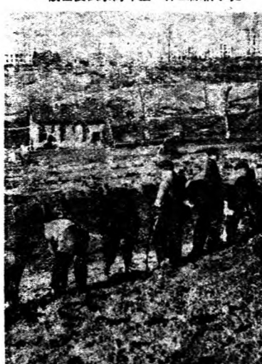
德馬里近郊，市工民作，觀舊復恢未向今至。作工除清成事

參戰，法國比荷的淪亡，差 不多已經把歐洲的大勢給 劃定了。戰爭既然由大陸 移到海洋，於是西班牙遂