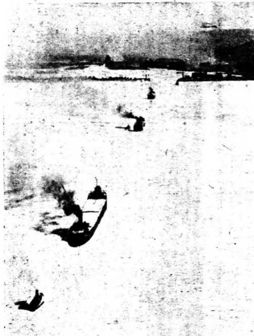
→往來於冰島海面之小型運輪船。

統之門羅主義。他方面，美國民主黨一系之報紙除以贊助之言詞擁護羅斯福此舉外，對於冰島在地理上是否應屬於西半球範圍之內，頗示疑問。總之，羅斯福於派軍進佔冰島之前，似已慮及由於此舉所引起之德國的反響，而具有很大的決心。此後德美在大西洋上衝突的可能性，愈益增大，其危機或較派艦護航為尤過之。所以，今日的冰島不啻為美國在大西洋上的第一道防線。