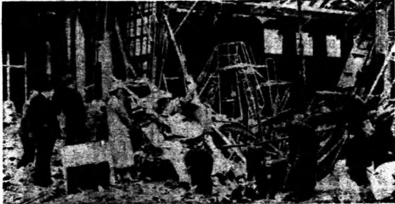
↑ 被炸之白金漢宮皇英、依莎利白皇后及首相吉爾爾親王至被毀處察視

街上被火光照射得異常明亮，滿地都是碎玻璃。我已無心注意這些。到家之後，我穿着衣服就倒在床上。因為我的住房外佈滿了塵土與破碎的木料，屋內也飛揚着塵土，我躺在床上打起噴嚏，連聲咳嗽起來。