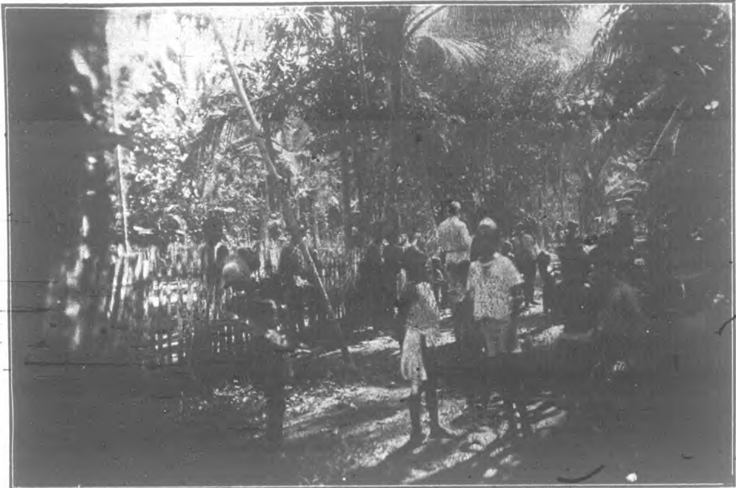
荷司鐸在廉居施藥情形