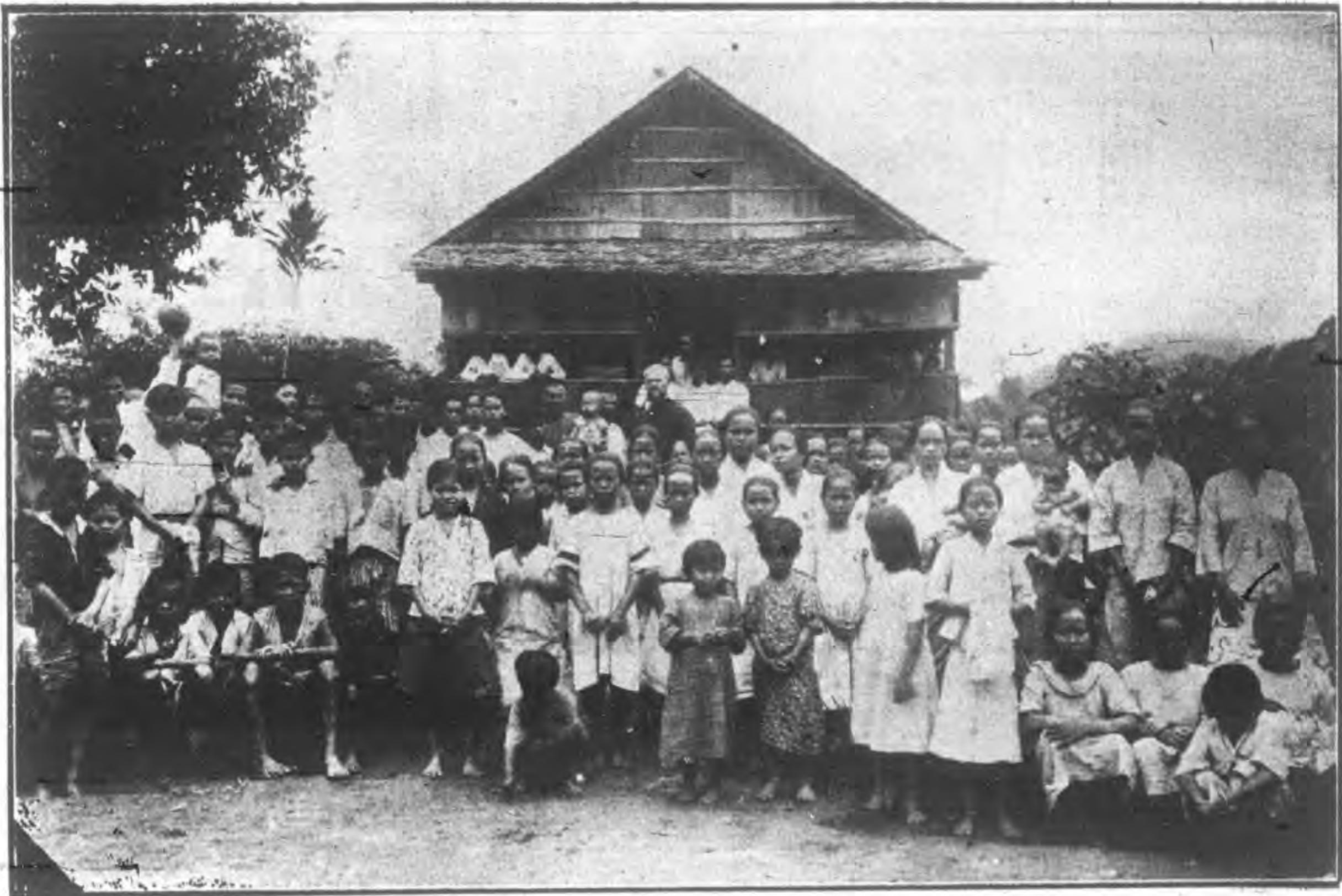
華僑沙零嘉天主堂