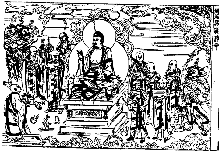
法苑珠林卷第五十九