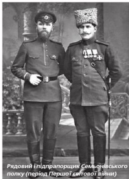
Рядовий і підпрапорщик Семьонівського полку (період Першої світової війни)

На довгі роки слово «гвардія» в СРСР було забуте. Проте з метою підняття бойового духу радянських воїнів у роки Великої Вітчизняної