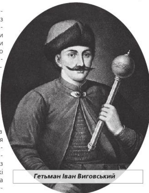
Гетьман Іван Виговський

щасливі походи 1654 і 1655 років, загинув за один день, і вже ніколи після того цар