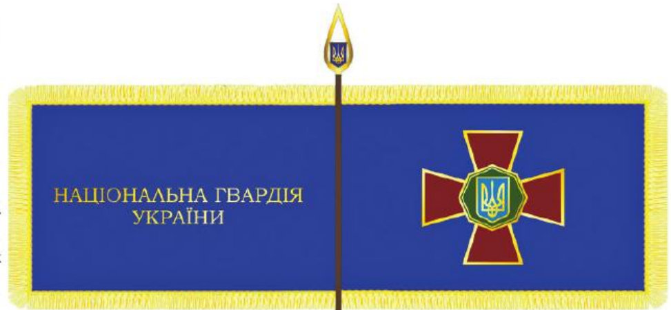
ПРАПОР НАЦІОНАЛЬНОЇ ГВАРДІЇ УКРАЇНИ

Виконуючий обов'язки Президента України, Голова Верховної Ради України Олександр ТУРЧИНОВ 12 травня 2014 року № 464/2014