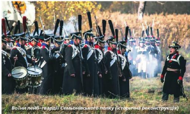
Воїни лейб-гвардії Семьонівського полку (історична реконструкція)

Потішні стали першими військовослужбовцями, які й зовні були схожі на представників кращих на той час європейських армій, і навчалися «іноземному строю». У 1691 році з потішних підрозділів, дислокованих у підмосковних селах Преображенському та Семьонівському, були сформовані два однойменні полки. У 1700 році вони стали називатися лейб-гвардійськими (від