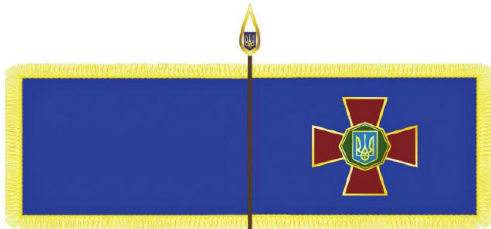
БОЙОВИЙ ПРАПОР ВІЙСЬКОВОЇ ЧАСТИНИ НАЦІОНАЛЬНОЇ ГВАРДІЇ УКРАЇНИ