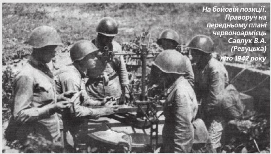
На бойовій позиції. Праворуч на передньому плані червоноармієць Савлук В.А. (Ревуцька) літо 1942 року

Відступали ми в бік Північного Кавказу. Пам'ятаю, якось зупинилися ми на