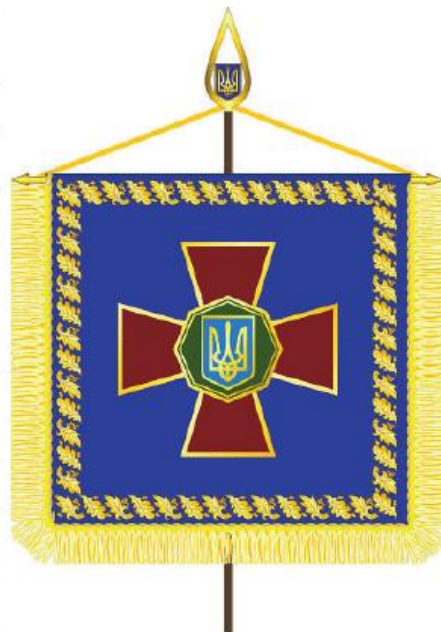
ШТАНДАРТ КОМАНДУВАЧА НАЦІОНАЛЬНОЇ ГВАРДІЇ УКРАЇНИ