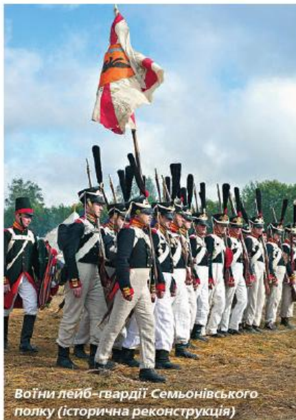
Воїни лейб-гвардії Семьонівського полку (історична реконструкція)

Назва прижилася, і з часом так стали іменувати відбірну, привілейовану частину