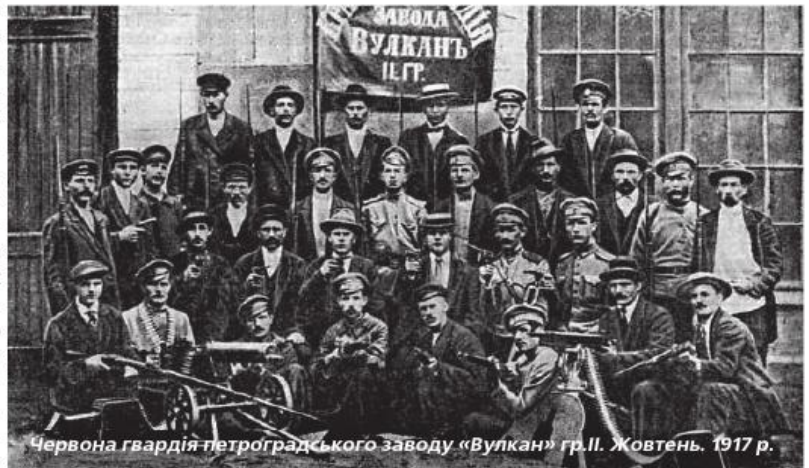
Червона гвардія петроградського заводу «Вулкан» гр.ІІ. Жовтень. 1917 р.

Для військовослужбовців гвардійських частин та з'єднань 21 травня 1941 року було