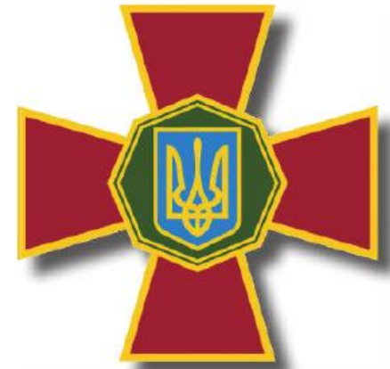
ЕМБЛЕМА НАЦІОНАЛЬНОЇ ГВАРДІЇ УКРАЇНИ