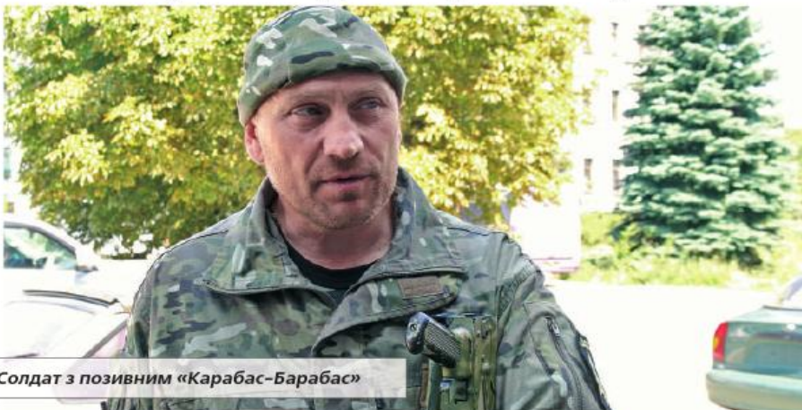
Солдат з позивним «Карабас-Барабас»