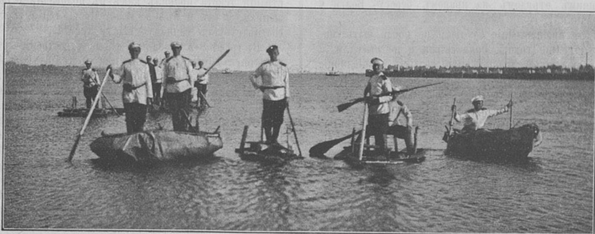
Переправа черезъ Волгу, на плавучихъ снарядахъ изъ подручнаго матеріала.

— Ну, а родъ занятій и приемы ихъ веденія?