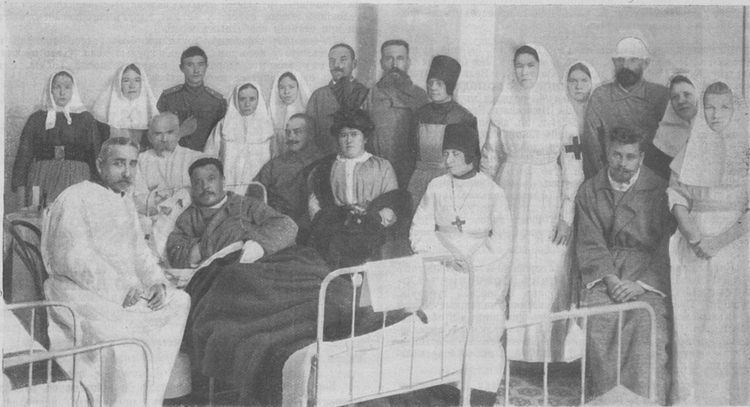
Раненые офицеры въ лазаретѣ Воскресенскаго Ново-дѣвичьяго монастыря.

«Прессбюро» дополняетъ это сообщеніе нѣкоторыми подробностями: 14-го ноября австрійцы произвели энергичныя атаки на фронтѣ Маліенъ—рѣка Лигъ—Лазаревацъ. Особенно ожесточенными были атаки противъ позицій у деревень Гукоче и Дудовацъ. Они были отражены на всемъ про-