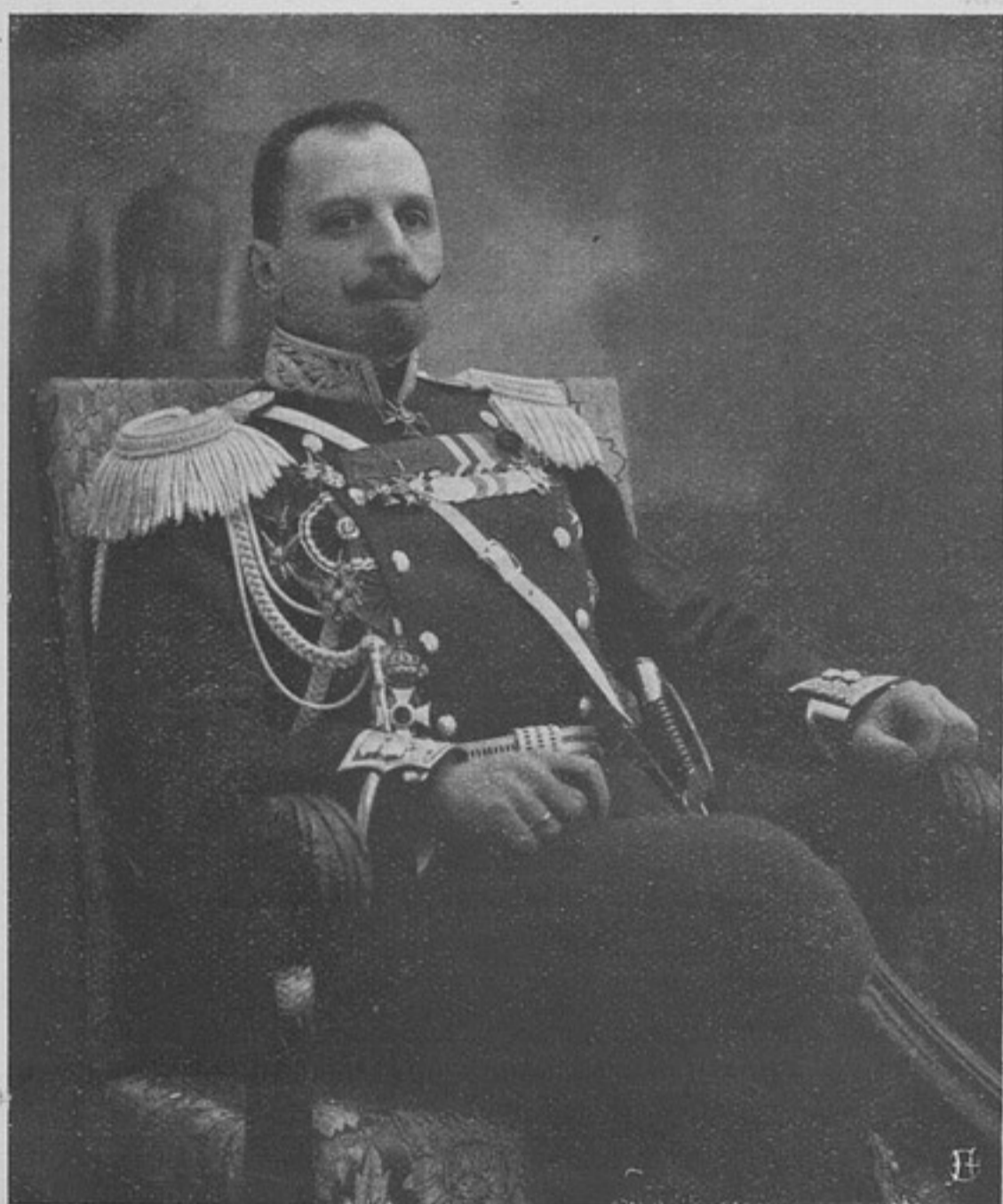
Командующій л.-гв. Уланскимъ Ея Величества Государыни Императрицы Александры Теодоровны полкомъ, полковникъ

СОДЕРЖАНИЕ: Портретъ полковника Дмитрія Максимовича Княжевича. — Распоряженія по военному вѣдомству. — Хроника. — Война 1914 года. — Георгіевскіе кавалеры. — Корреспонденція. — Свѣдѣнія объ убитыхъ и раненыхъ. — Вопросы и отвѣты №№ 5141—5143. — Объявленія. — Высочайшіе приказы.