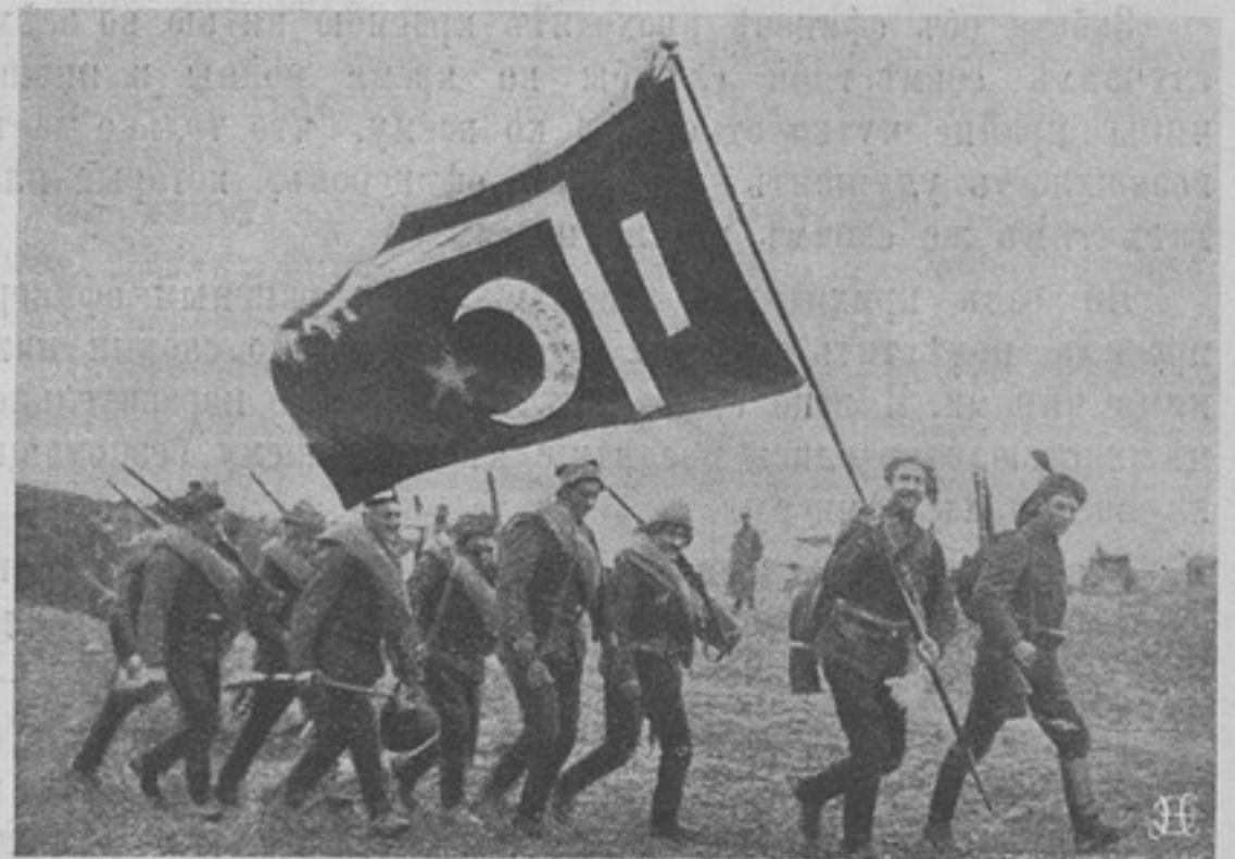
Турецкая пѣхота на походѣ.

Свистя и завывая, проносится въ вышинѣ тяжелый снарядъ тяжелаго орудія и, упавъ на землю, съ оглушительнымъ громомъ взрывается, образуя глубокую воронку.