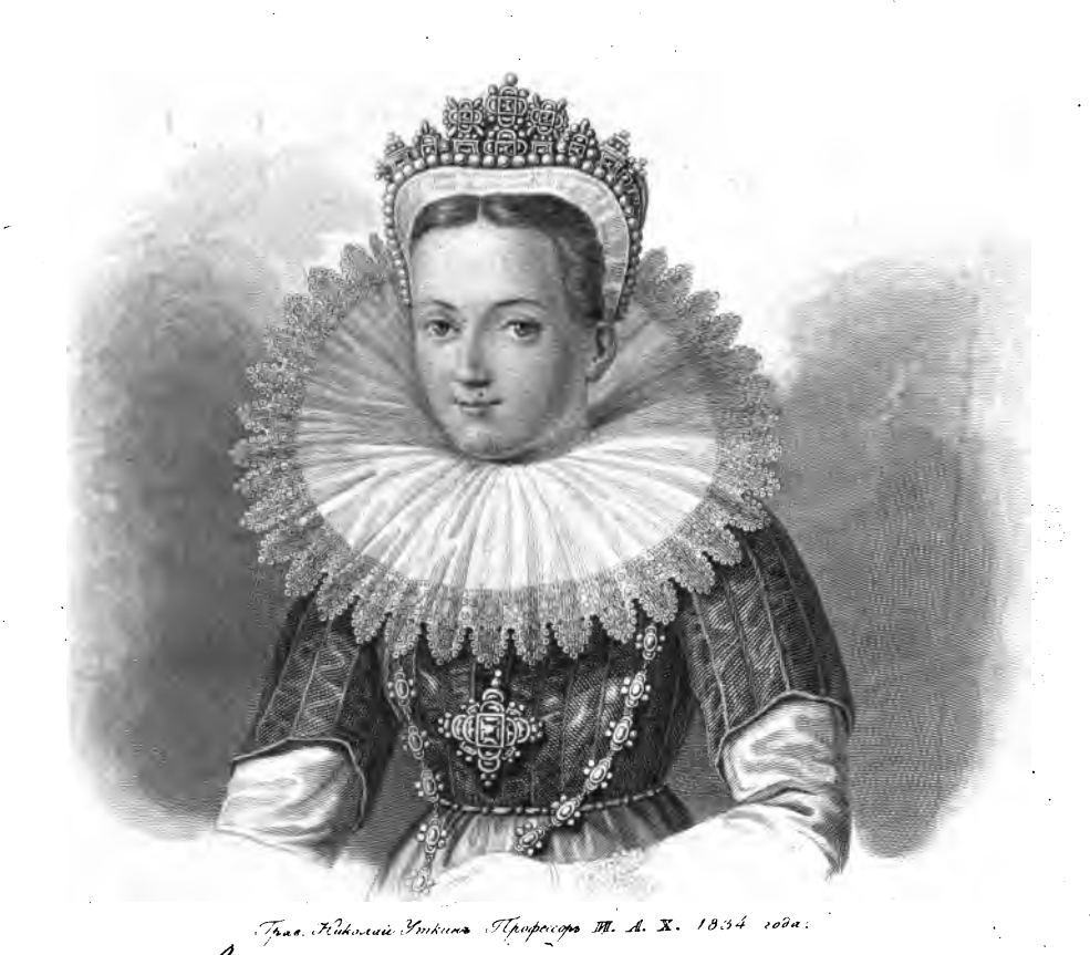
Kina nanisg je Corba powlera mar jna jaron L.