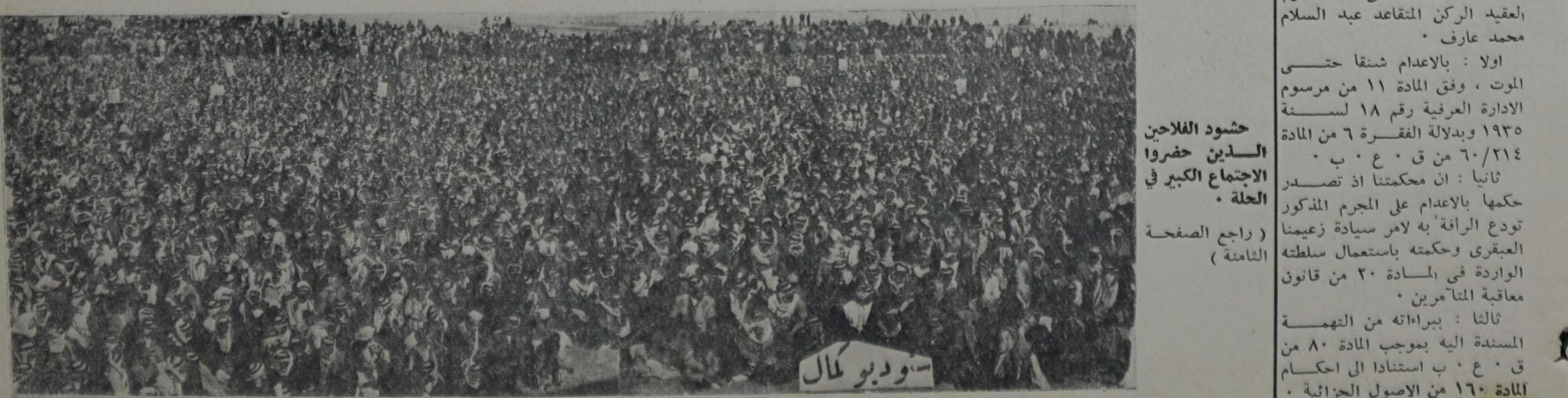
حشود الفلاحين الذين حضروا الاجتماع الكبير في الحلة .

القاهرة - نشرت صحيفة المجاهد الناطقة بلسان جبهة التحرير الوطني الجزائرى تصريحاً للسيد فرحات عباس رئيسى حكومة الجزائر الحرة حذر فيه الشركات الاجنبية من توقيع الاتفاقيات مع فرنسا لاستغلال مصادر البترول فى صحراء الجزائر . واضاف السيد فرحات عباس ان الصحراء هي من حق الشعب الجزائرى وانه لا قيمة لاي عقود توقع او اية امتيازات تمنحها الحكومة الفرنسية .