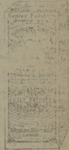
شكل مصغر جداً

محلول ، كبلار ، يشفي من امراض الملاريا والعاثون وكل مرض يمتري الانسان خصوصاً من لا يستطيع ان يتناول غذاه العادي . وبعد المداومة على تناطيه يتحول الجسم من المرض الى القوة والسمن وترجع القوة كما كانت