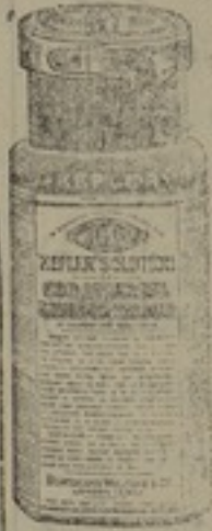
شكل مصغر جداً

محلول ، كبلار ، هو اعظم طعام مقو يساعد السن وله مفعول كبير في تركيب الجسم محلول ، كبلار ، يتحول بسرعة غريبة الى دم وعضلات ومادة لحمية ودهنية وعظمية ونخية محلول ، كبلار ، يشفي من امراض السل اذا اخذ في حينه واذا تناولها الشبان المصابون بامراض الظهر والساق ثلاث مرات كل يوم قوى بدنتهم واستطالة قامتهم