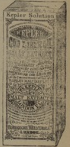
شكل مصغر جداً

والساق ثلاث مرات كل يوم قوى بدنهم واستعالة قائمهم محلول. كپلار ، يشفي من امراض الملايا والطاعون وكل مرض يمتري الانسان خصوصاً من لا يستطيع ان يتناول غذاه العادي . وبعد المداومة على تناوله يتحول الجسم من المرض الى القوة والسمن وترجع القوة كما كانت .