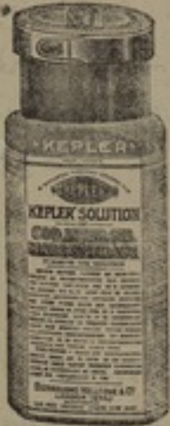
شكل مصغر جداً

محلول ، كپلار ، هو اعظام طعام مقو يساعد السن وله مفعول كبير في تركيب الجسم محلول ، كپلار ، يتحول بسرعة ضربة الى دم وعضلات ومادة لحية ودهنية وعظمية ونخية محلول ، كپلار ، يشفي من امراض السن اذا اشتمت في حينه واذا تناوله الشبان المصابون بامراض الظهر