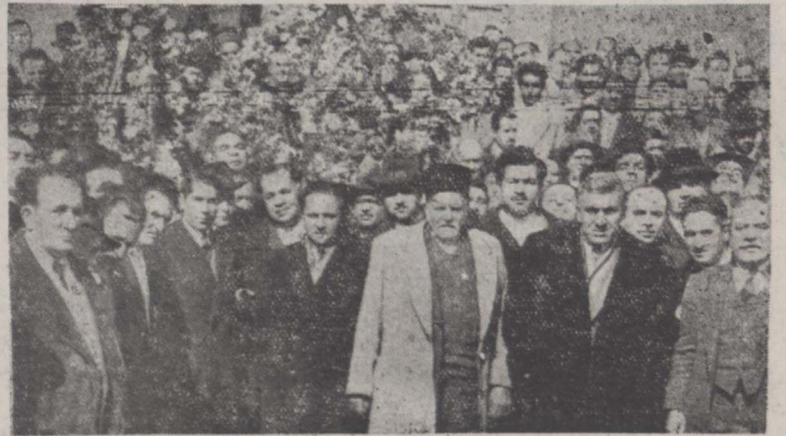
اعضای هیئت مدیره اصناف تهران هنگام ورود بارامگاه اعلیحضرت فقید