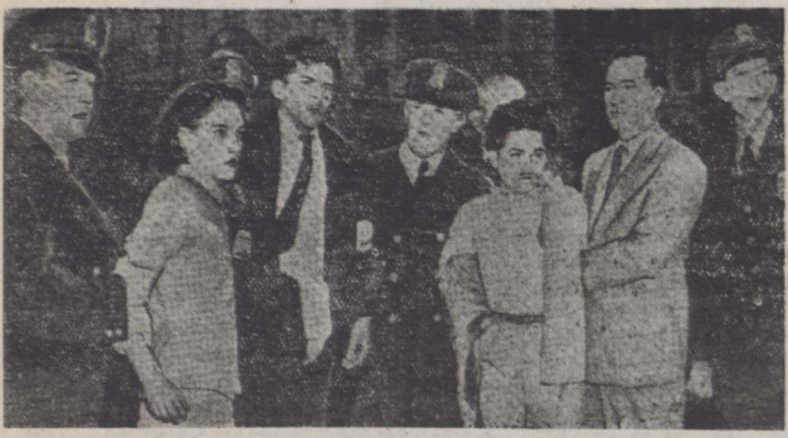
سوء اقتصادی که در مجلس نمایندگان امریکایس از خلع سلاح

خبر نگار ما درواشنگتن جریان مشروح تیراندازی در مجلس نمایندگان امریکا را بضمیمه عکسهای از سوء اقتصادی که در آنجا مشاهده شده اند برای ما ارسال داشته است که بظرف خوانندگان محترم میرسد