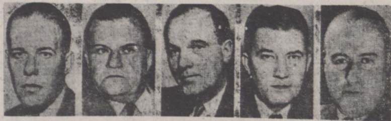
از راست بچپ: جرج فالون (دموکرات) کتیت در برتر (دموکرات) بین جانسون (جمهوریخواه) کلیفورد بویس (دموکرات) والوین بنتلی (جمهوریخواه) نیاندگان پارلمان امریکاکه در واقعه هفته گذشته مجروح شدند

واشنگتن هفته گذشته واقعه ای در مجلس نمایندگان امریکا رخ داد که موجب هیجان شدیدی در سر امریکا دید. سه نفر از اهالی پورتوریکو، يك ن ۳۴ ساله بنام لولیتا لیرون و دو نفر ۱۰۰ و بیست و نه و بیست و هفت ساله در ليکه فریاد میزدند « کشور ما را بقیه در صفحه چهارم