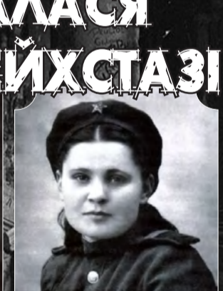
Фельдшер батальйону, фортеця Дублін на Віслі, Польща, 1944 р.