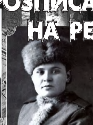
Фельдшер батальйону запасного танкового полку, м. Омськ, 1943 р.