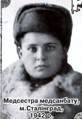
Медсестра медсанбату, м. Сталінград, 1942 р.