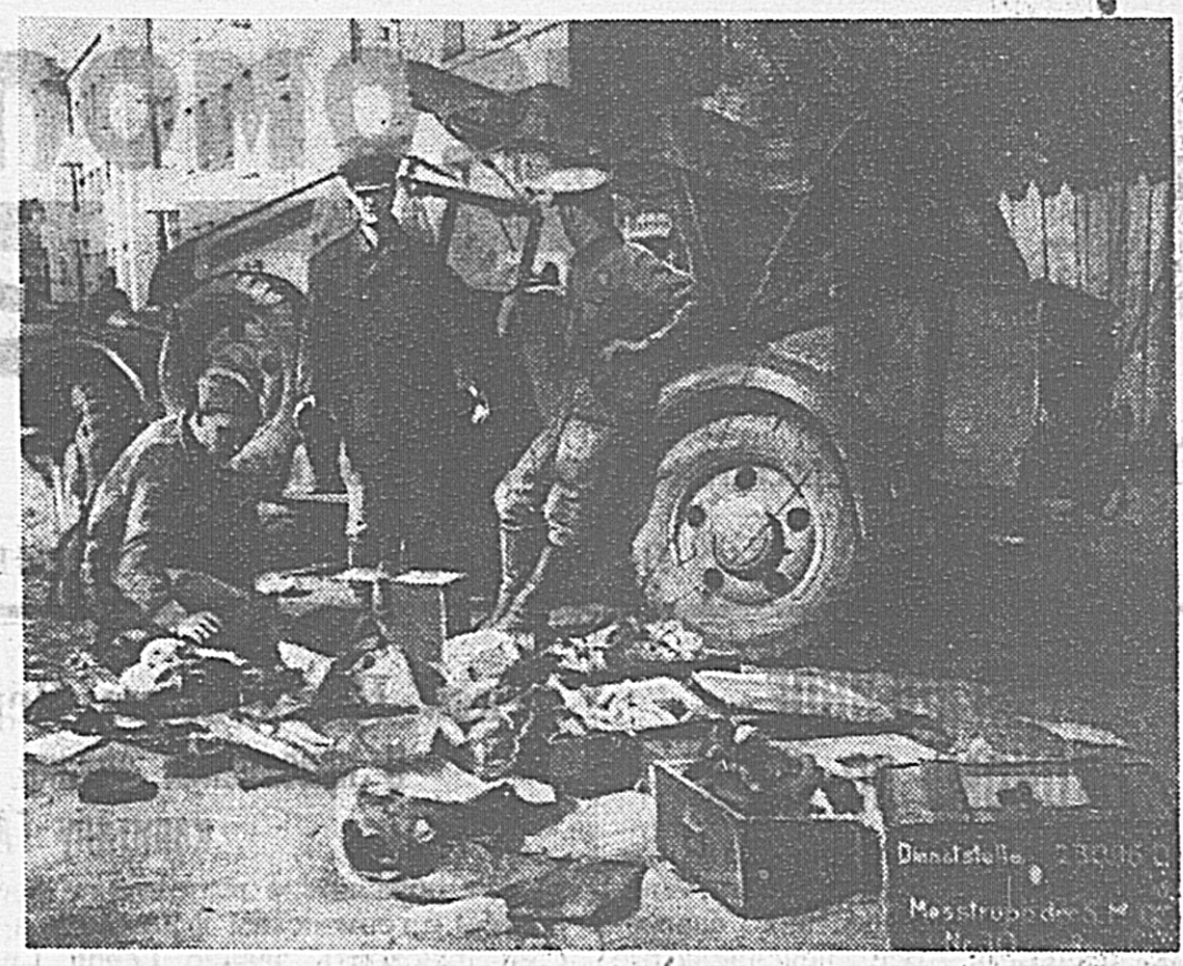
В Действующей армии. На улицах городка В., из которого доблестные части Красной Армии выбили гитлеровских захватчиков. Бойцы осматривают штабную машину, разбитую нашим артиллерийским огнем и брошенную фашистами.