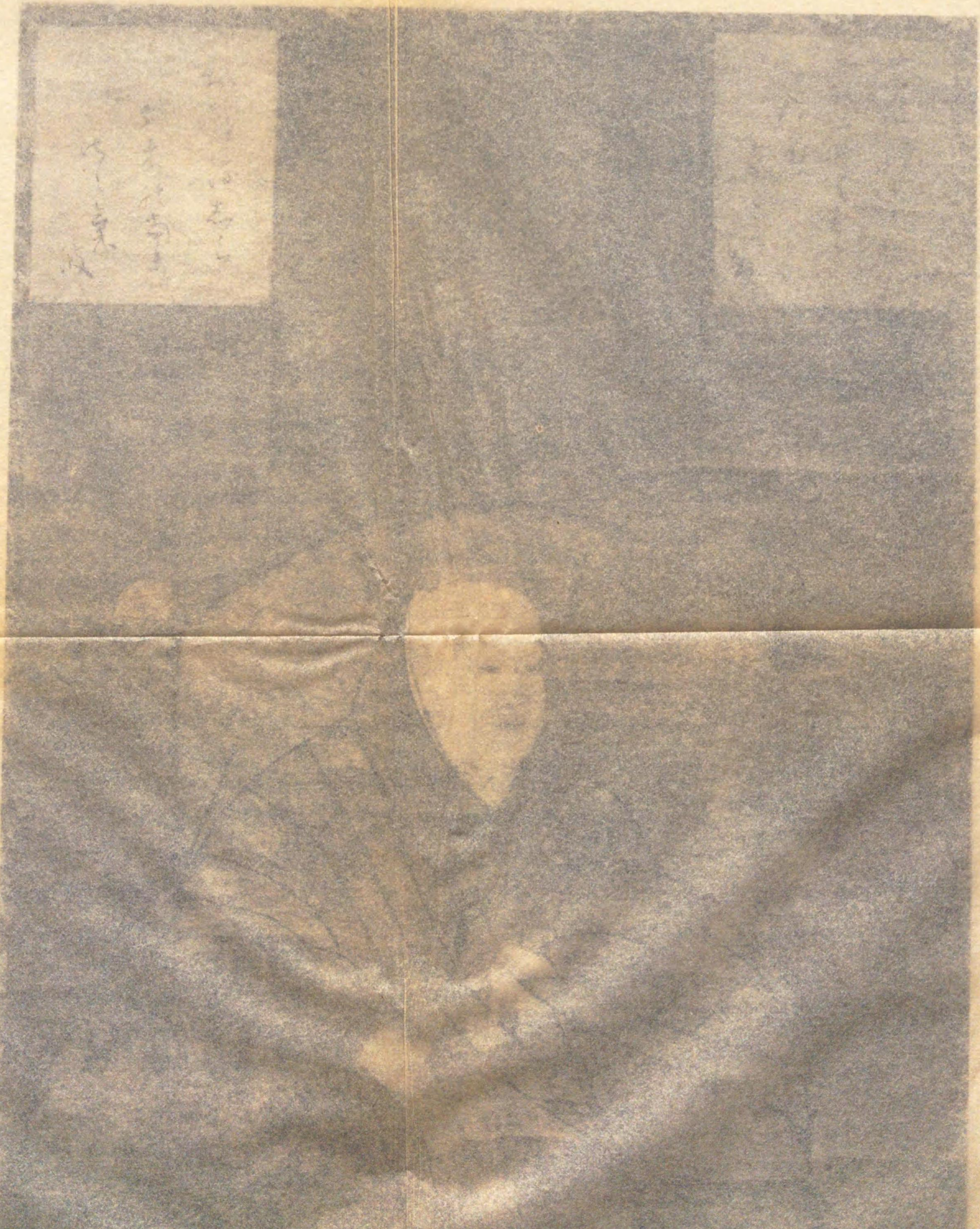
宇多天皇宸影 山城仁和寺所藏