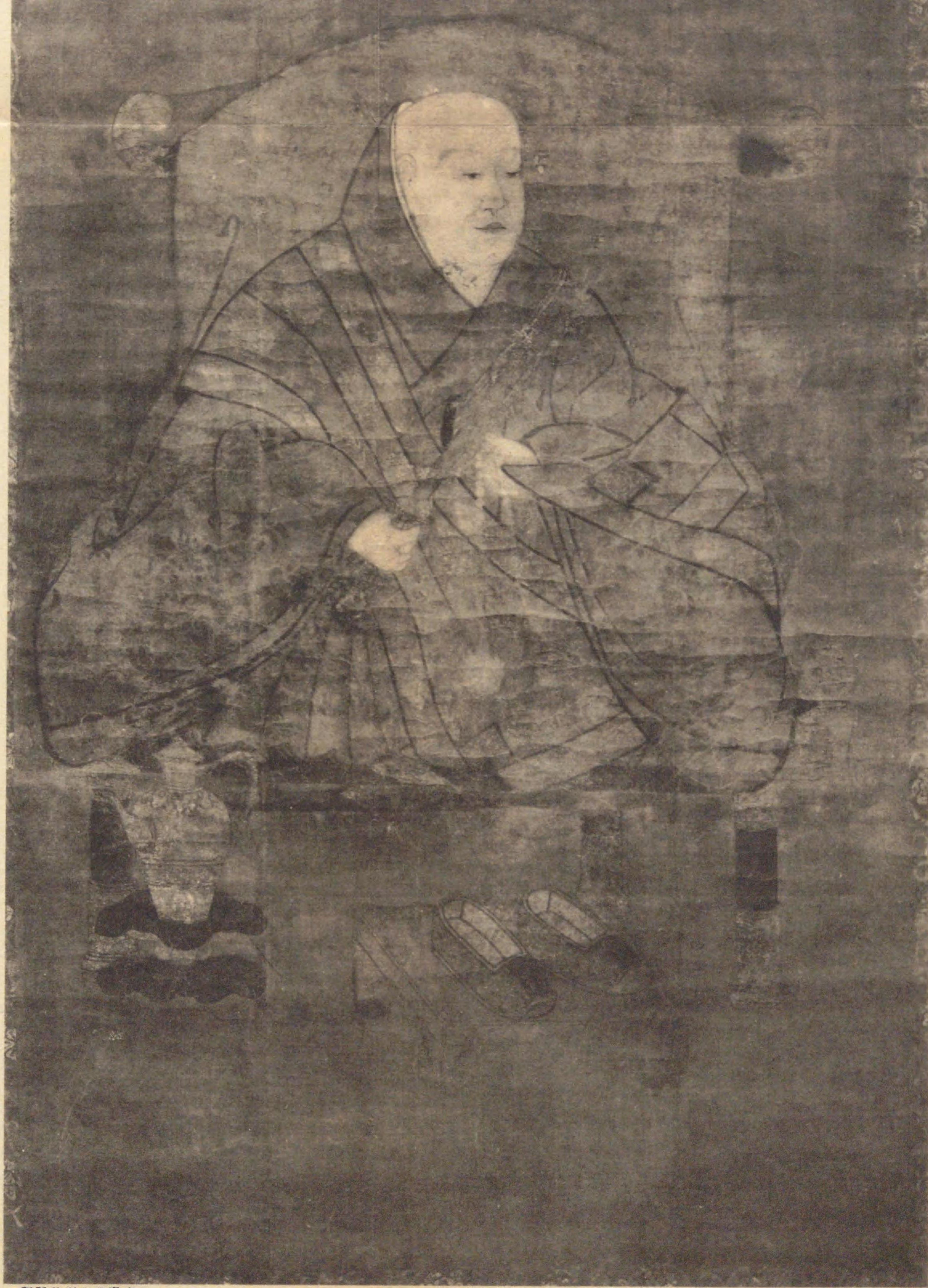
版製社刷印真寫京東