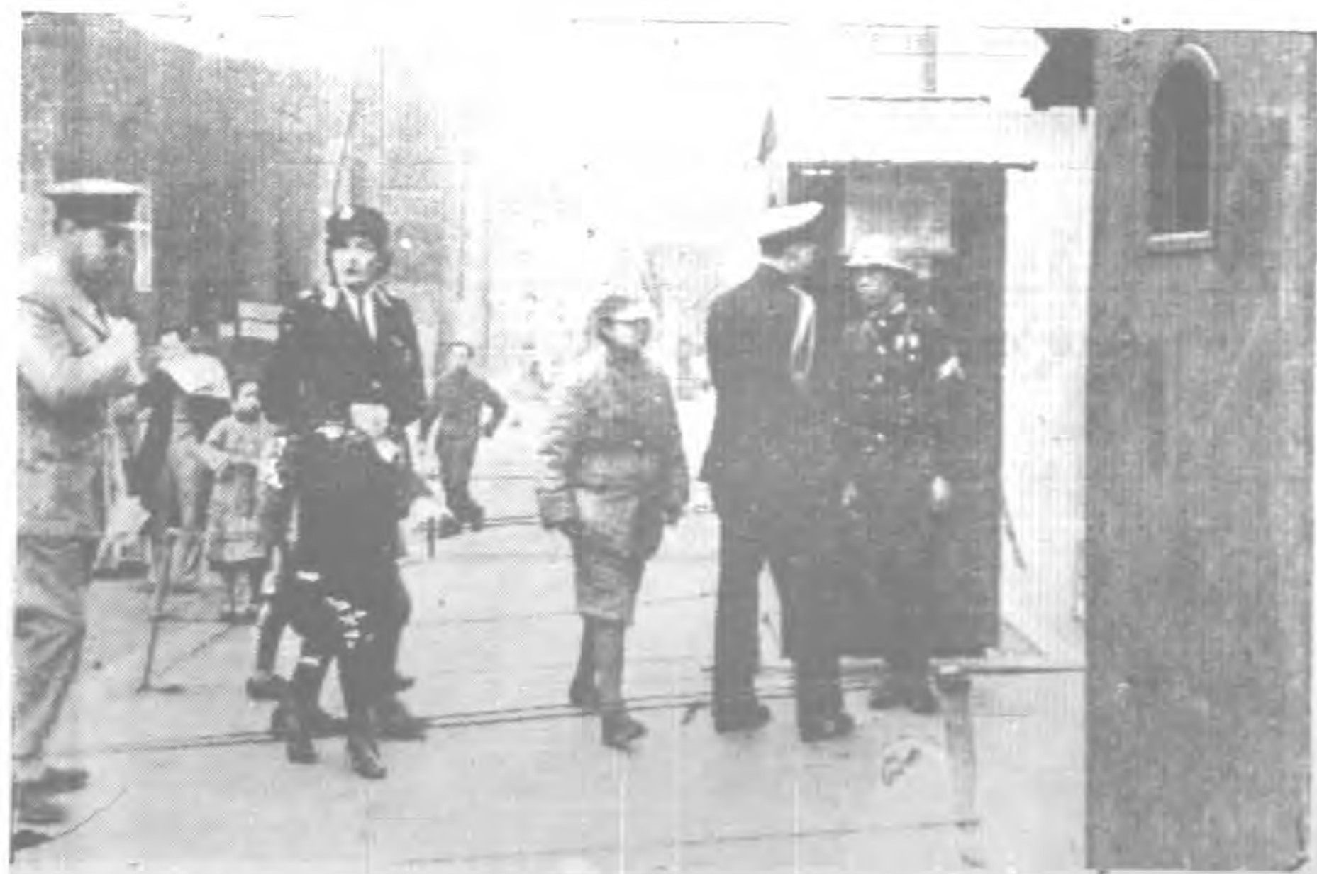
說明：蒙巴頓夫人代表英國紅十字會，於三月七日由印度搭機飛渝，參觀我國戰時救濟作業。當彼抵渝後，本會曾設宴招待，以示歡迎之意。彼並參觀本會在渝各單位。對照上圖示彼在新運診療所中訪問情形。*右圖示彼正在向該診所行進中。