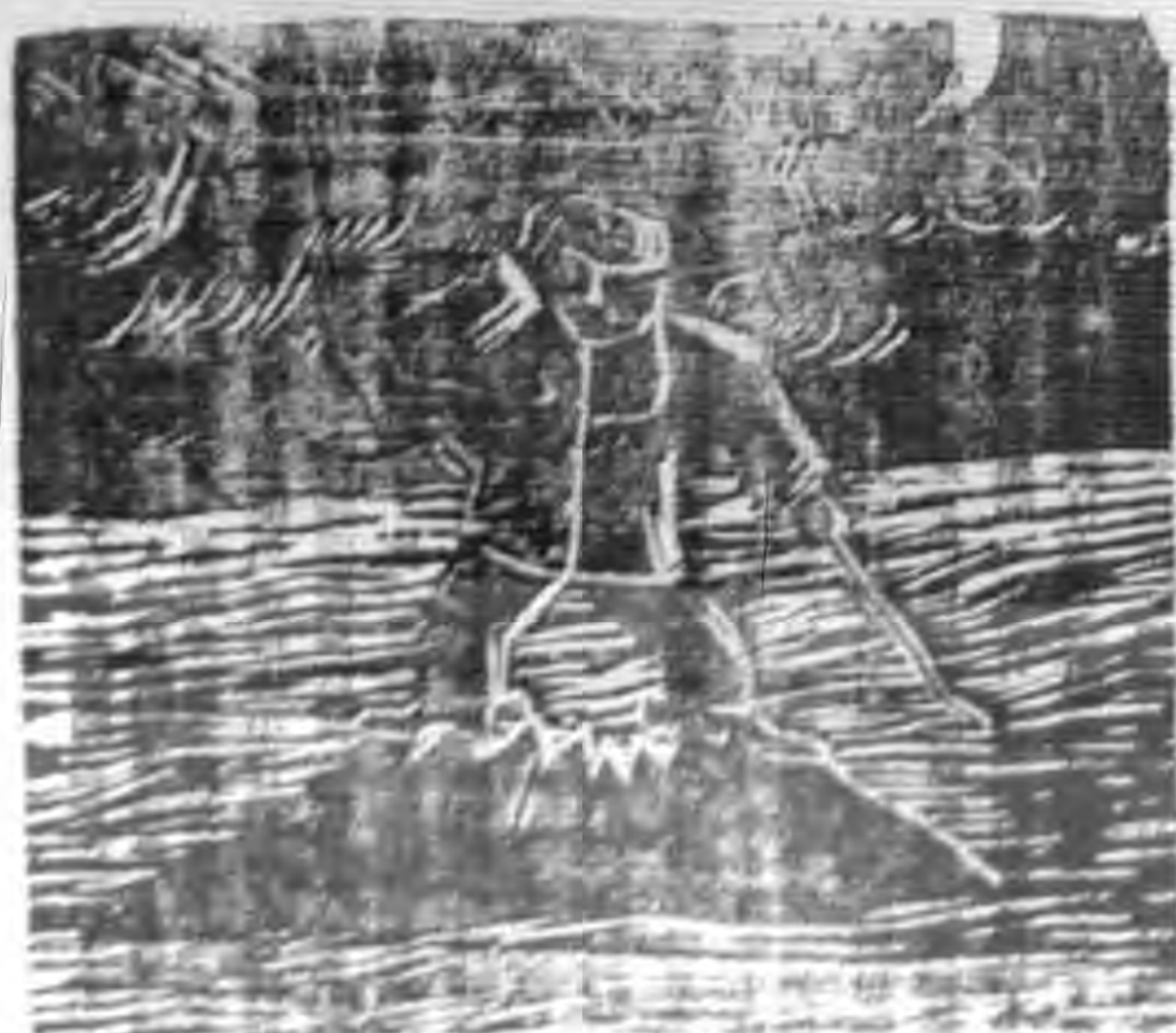
日寇侵略中國之慘狀

手；而國內政治矛盾日益劇烈，國民的解脫痛苦與日俱增，將加速日寇的崩潰。這一次湘北空前的暴動，就是中國要打贏，敵人愈打愈窮的表示。只要全國同胞能動起我們的神念，——抗戰必勝建國必成，集中意志與力量，在最後關頭用之下，不勝難若，堅持抗戰，日寇是必然要崩潰的。中華民族解放之期快要到臨了，努力吧！ 二十八年十月二十八日（廣州）