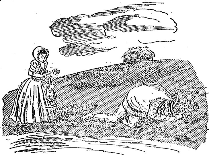
藍國王子和白國公主相遇