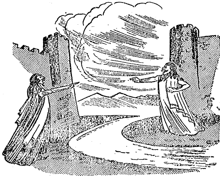
白 國 大 使 和 藍 國 大 使 對 罵