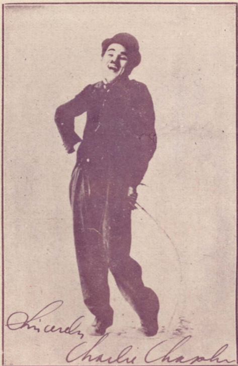
英 國 之 笑 匠 卓 別 靈 氏