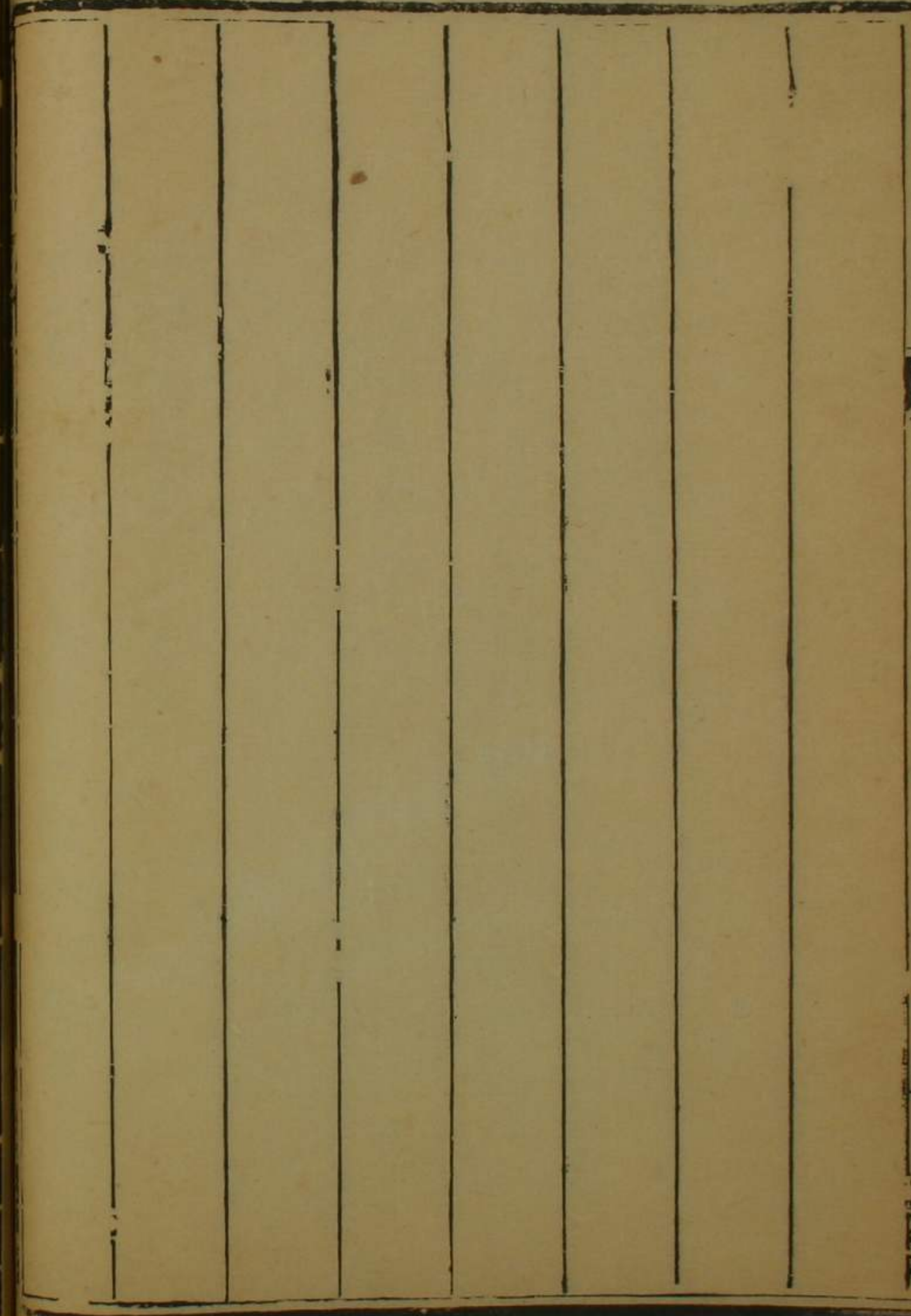
泰寧協右營轄大田西番民