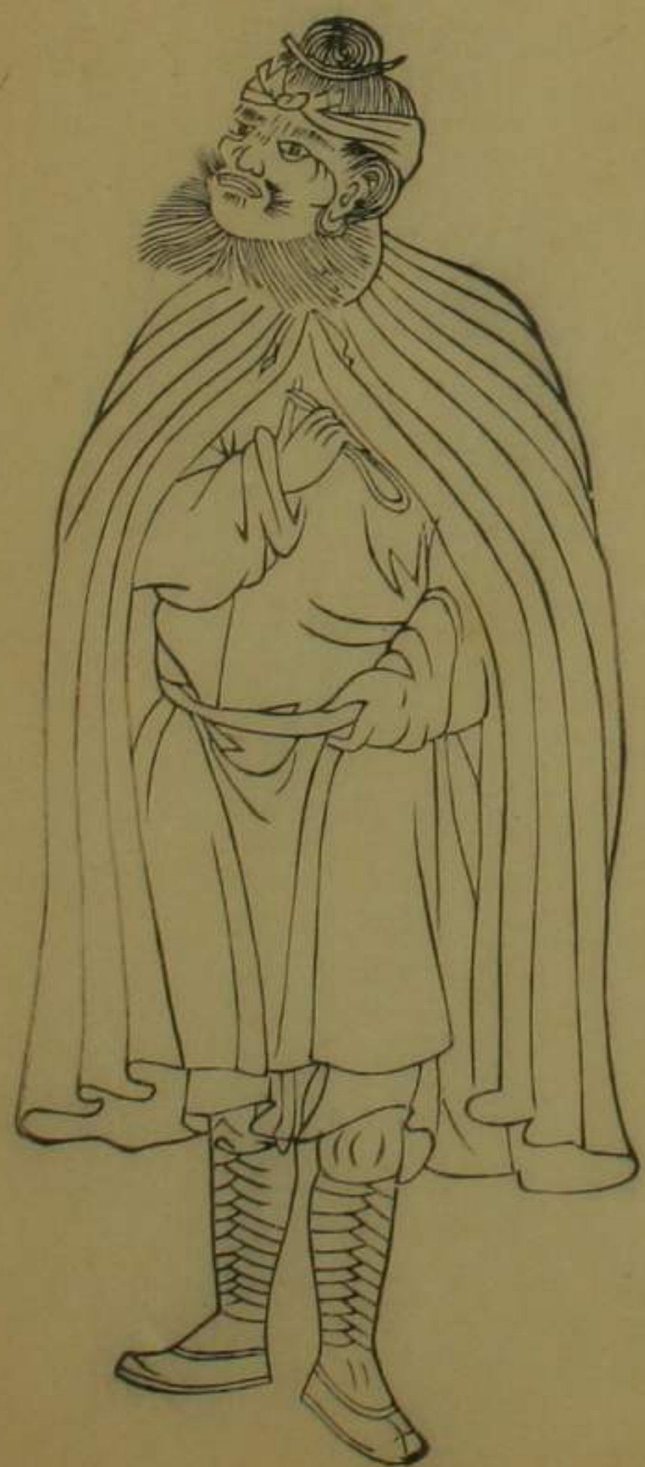
泰寧協右營轄大田猓獮