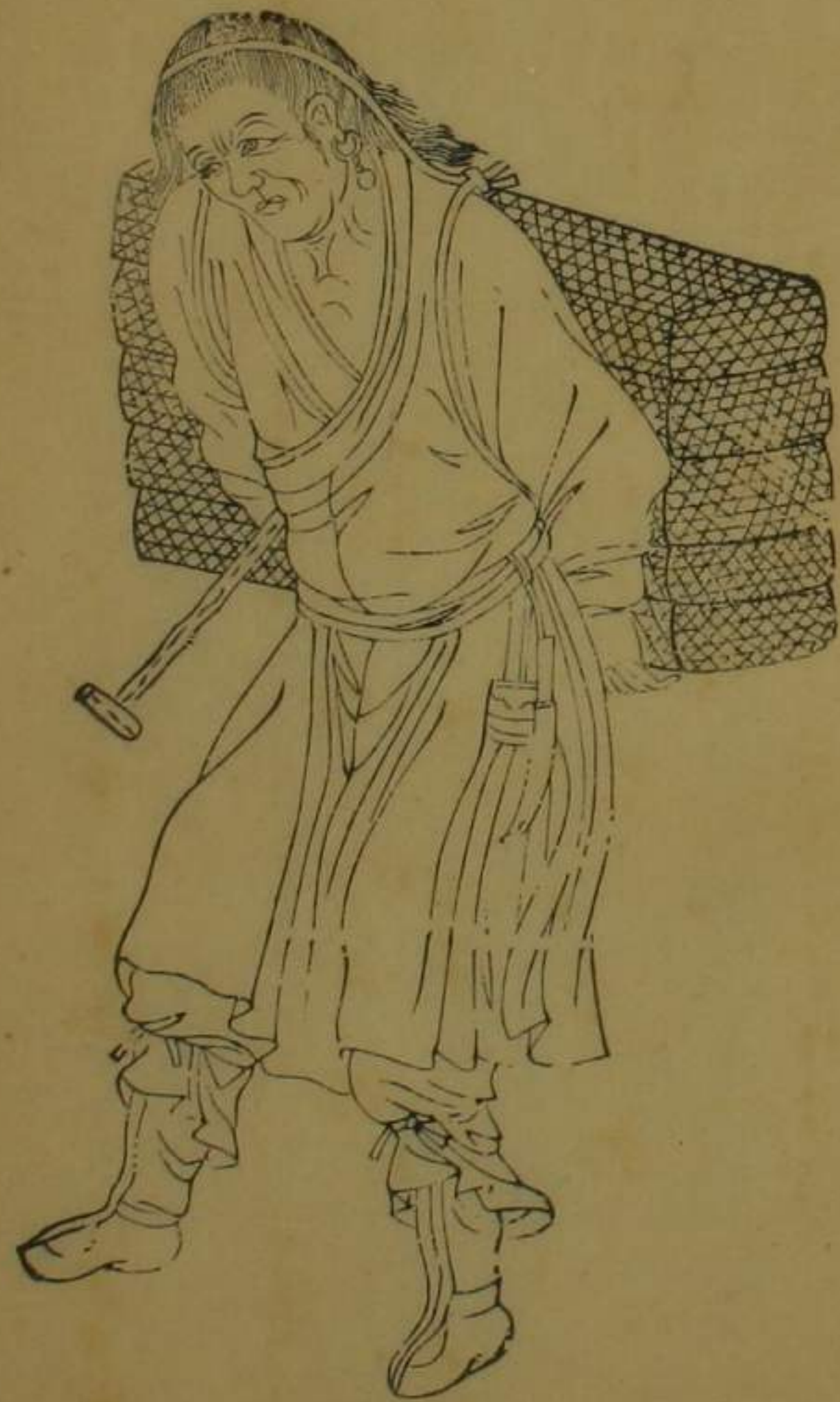
阜和營轄咱里番民