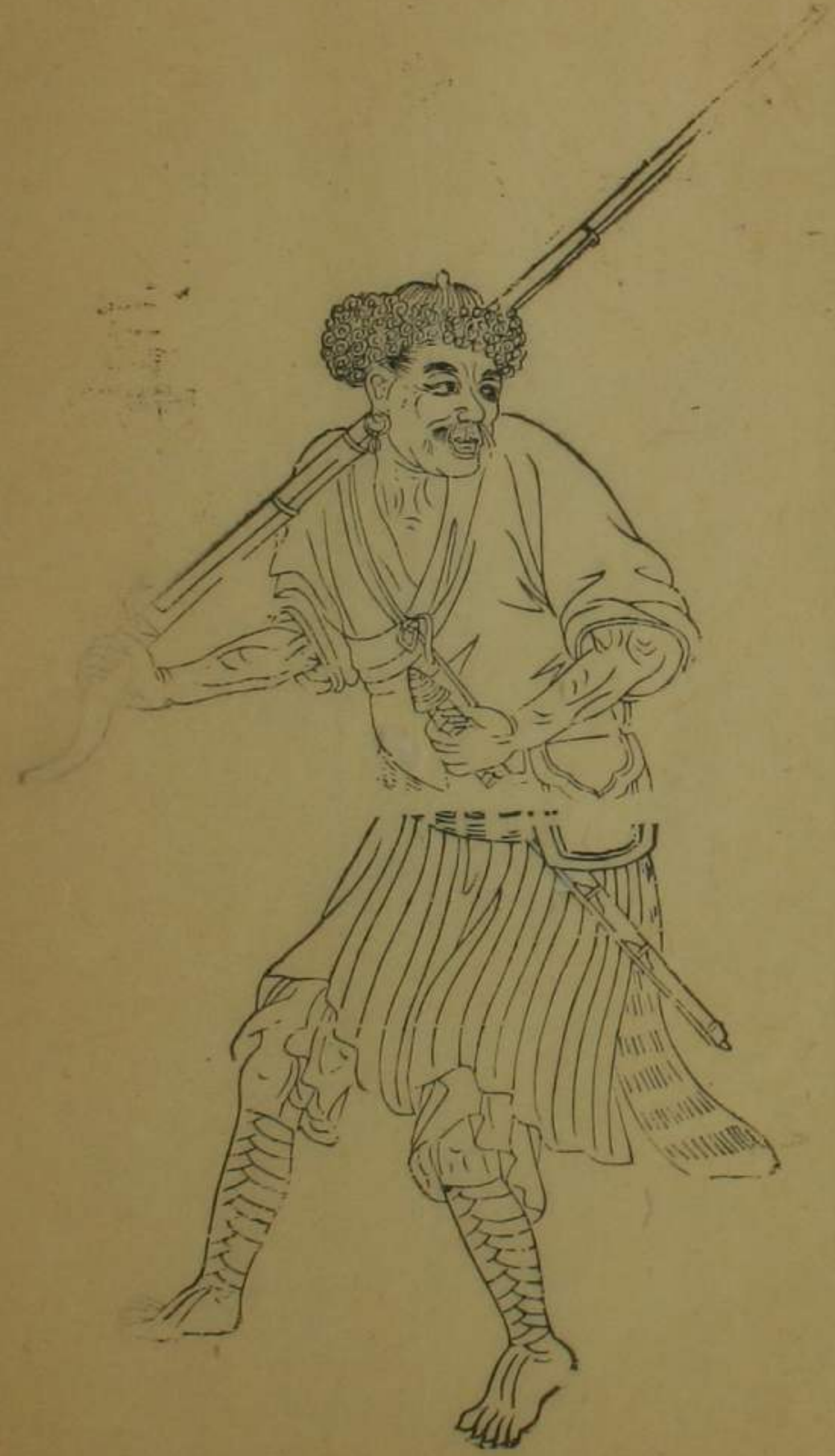
阜和營轄綽斯甲番民