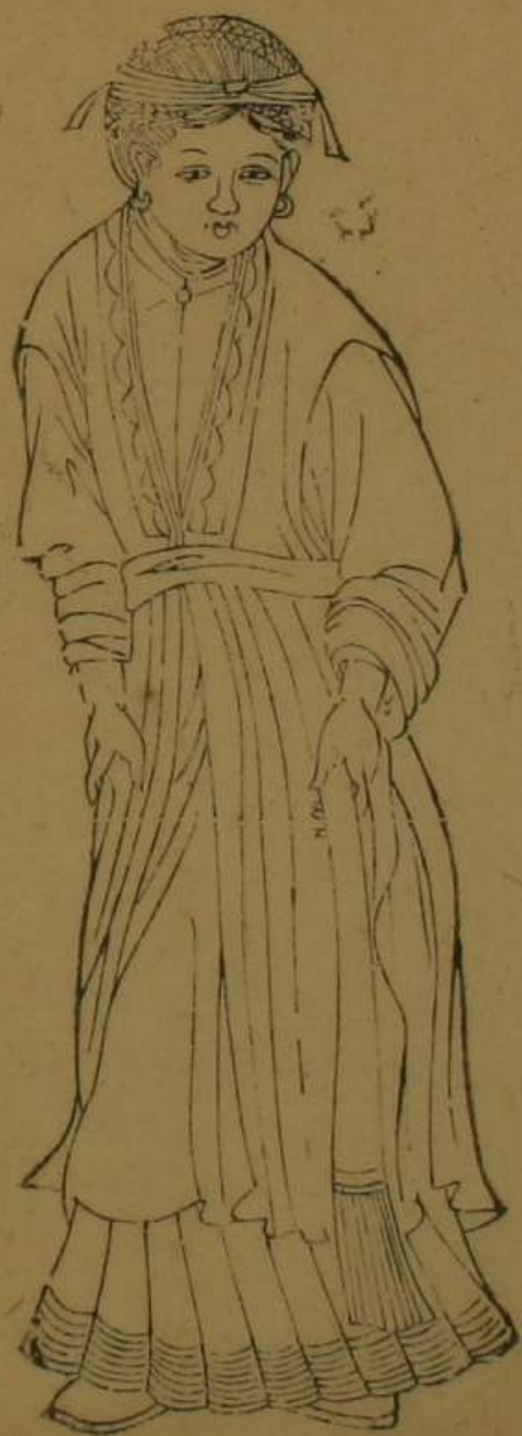
泰寧協標右營松坪夷婦