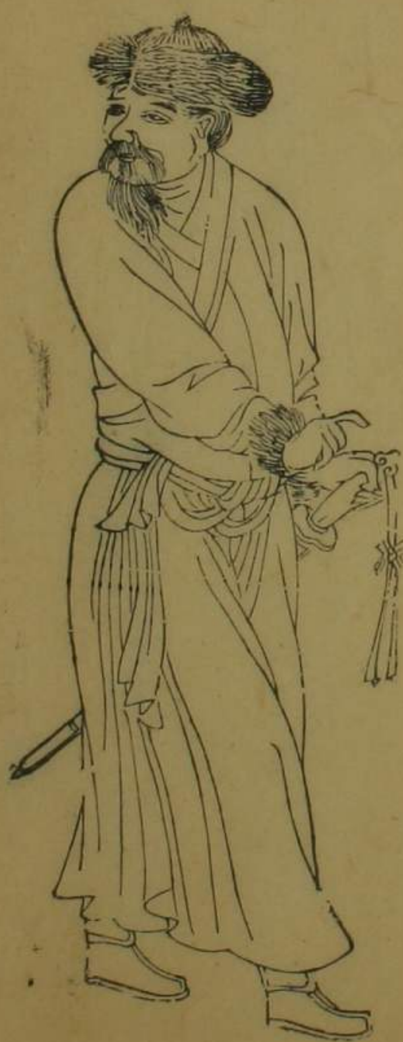
阜和管轄德爾格特番只