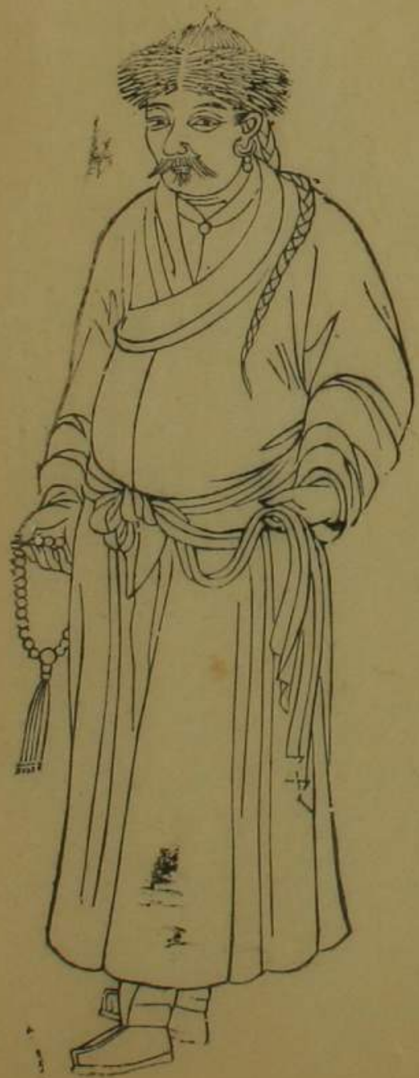
泰寧協屬巴塘番民