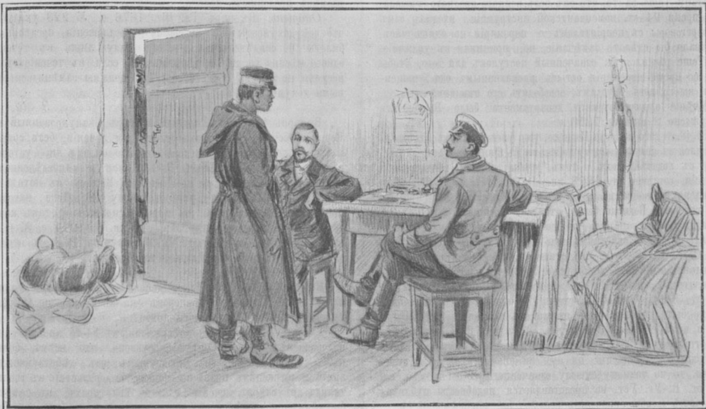
Допросъ плѣннаго японца въ Мукденѣ.