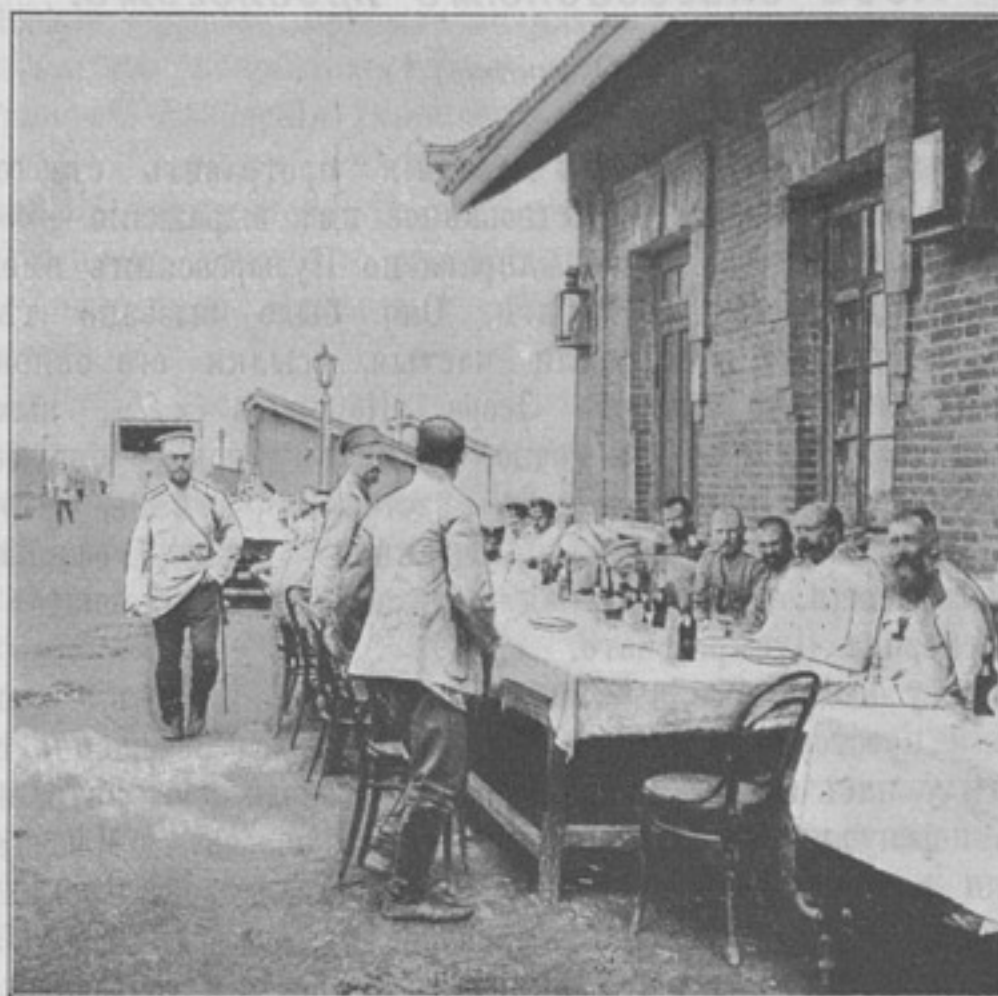
На ст. Дашичао—буфетъ. (Фотогр. шт. ротм. Карпова, собств. корресп.).