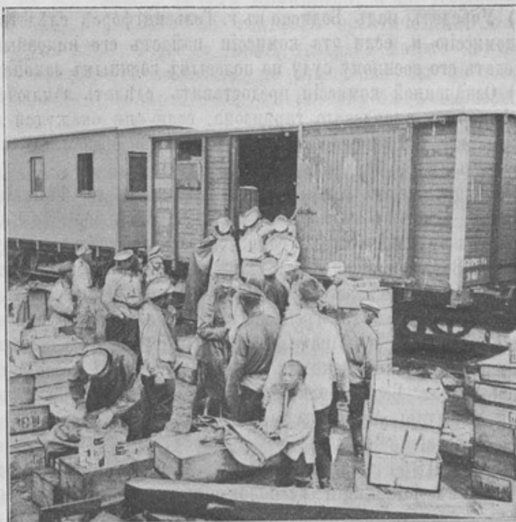
Лавка-вагонъ гвард. экон. общества въ Мукденѣ.