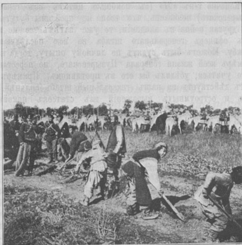
Пограничная стража въ походѣ. Китайцы исправляютъ дорогу.