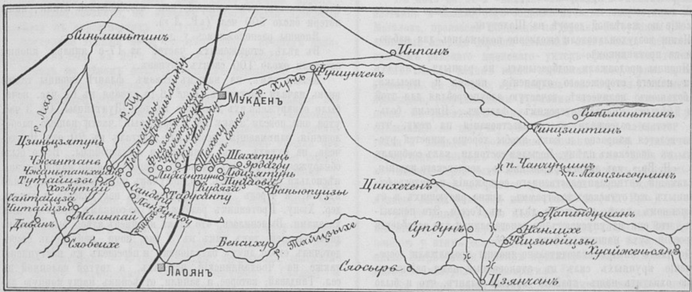
Схема района военныхъ дѣйствій съ 16-го по 23-е января.

Въ происшедшихъ съ 12-го по 16-е января бояхъ, въ особенности при возвращеніи на занятія позиціи, мы понесли