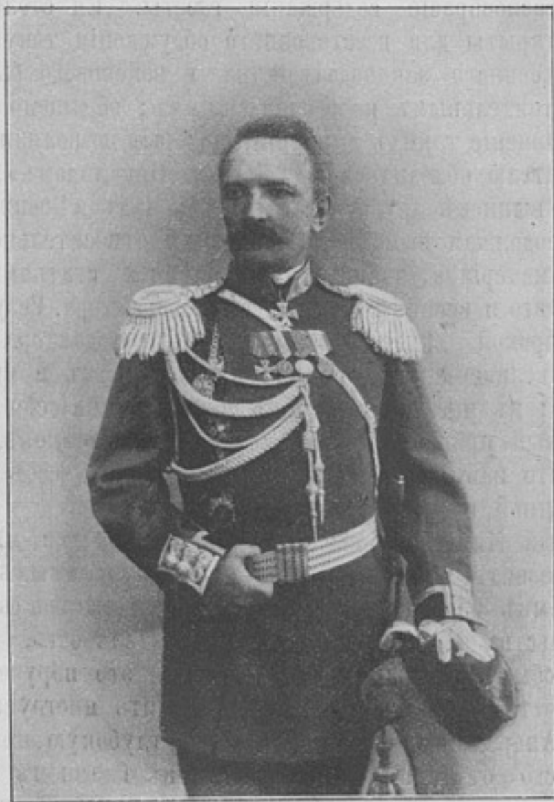
Начальникъ 49-й пѣхотной резервной бригады, генералъ-маіоръ

Цѣна по подпискѣ на II-ю серію остается прежняя: по 1 р. 50 к. за выпускъ. За 8 полувыпусковъ безъ доставки 6 р., съ достав. и перес. 8 р. Отдѣльно полувы- пуски будутъ продаваться по 1 р., съ перес. 1 р. 25 к., съ налож. платеж. 1 р. 35 к. Цѣна Первой Серіи , первые четыре выпуска 6 р., съ перес. и упаковк. 7 р. 50 к. Роскошные коленкоровые переплеты заготовлены для первой серіи по 1 р. 50 к., съ перес. 2 р.