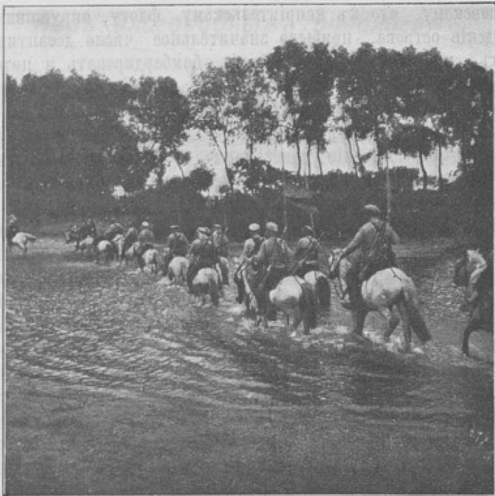
Переправа черезъ рѣчку 41-ой сотни Погран. Стражи.

кина, на каждое орудіе до 20 снарядовъ; продовольственныхъ же припасовъ, какъ объяснилъ самъ ген. Бодиско, было заготовлено по декабрь мѣсяць 1854 г.