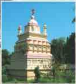
रत्नेश्वर मंदिर (जुने व नवे स्वरूप)