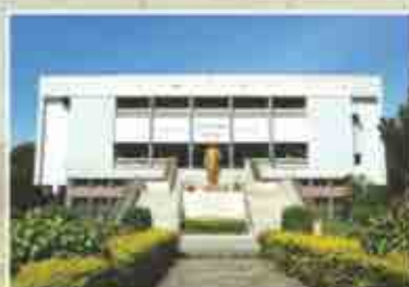
यशवंतराव चव्हाण स्मृतिसदन