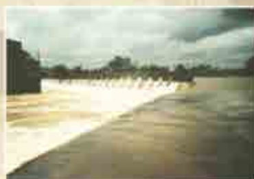
खोडशी येथील कृष्णा नदीवरील बंधारा