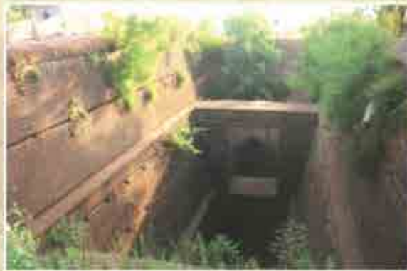
नकट्या रावळ्याची विहीर - उपेक्षित आणि संरक्षित