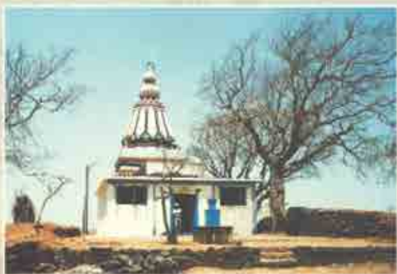
सदाशिवगडावरील महादेव मंदिर