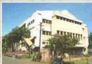
सी. वेणुताई चव्हाण स्मारक