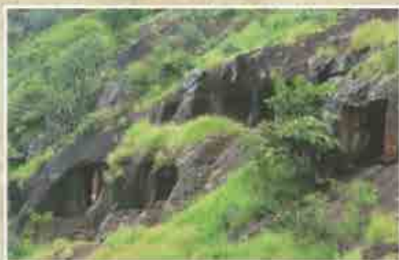
अगाशिवाच्या डोंगरातील लेणी