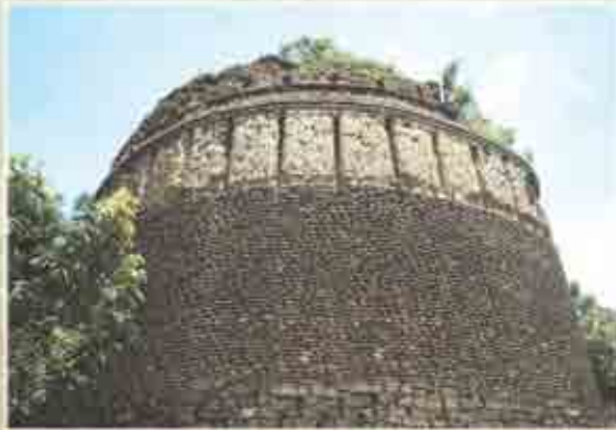
भुईकोट किल्ल्याचा बुरूज