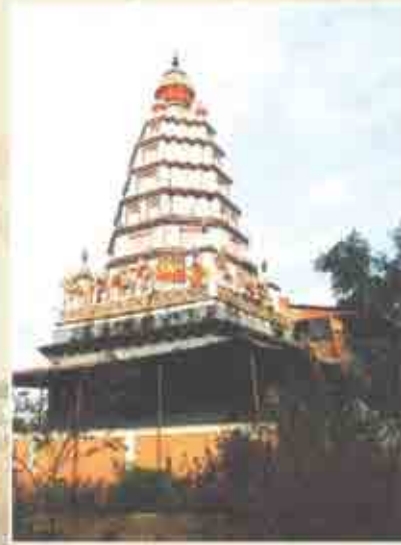
संत सखूचे विद्वल मंदिर