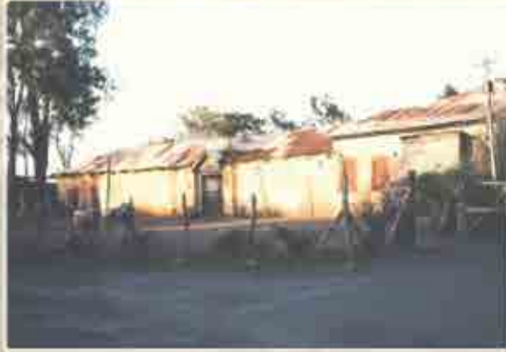
कोटातील पंतप्रतिनिधीचा वाडा