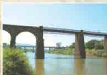
कोयना नदीवरील जुना आणि नवा पूठ