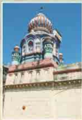
हाटकेश्वर मंदिर (जुने व नवे स्वरूप)