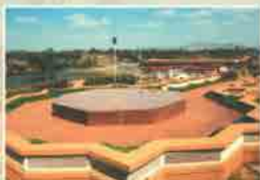
यशवंतराव चव्हाण पांची स्माधी