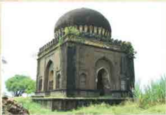
मटेका घुमट, मलकापूर