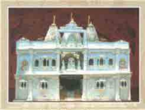
कन्हाडातील जुने जैन मंदिर : नवे स्वरूप