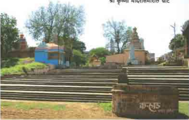
श्री कृष्णा मंदिरसमोरील घाट