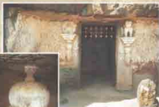
लेणे क्र. ६