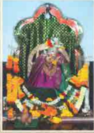
ग्रामदेवत श्री कृष्णाबाई