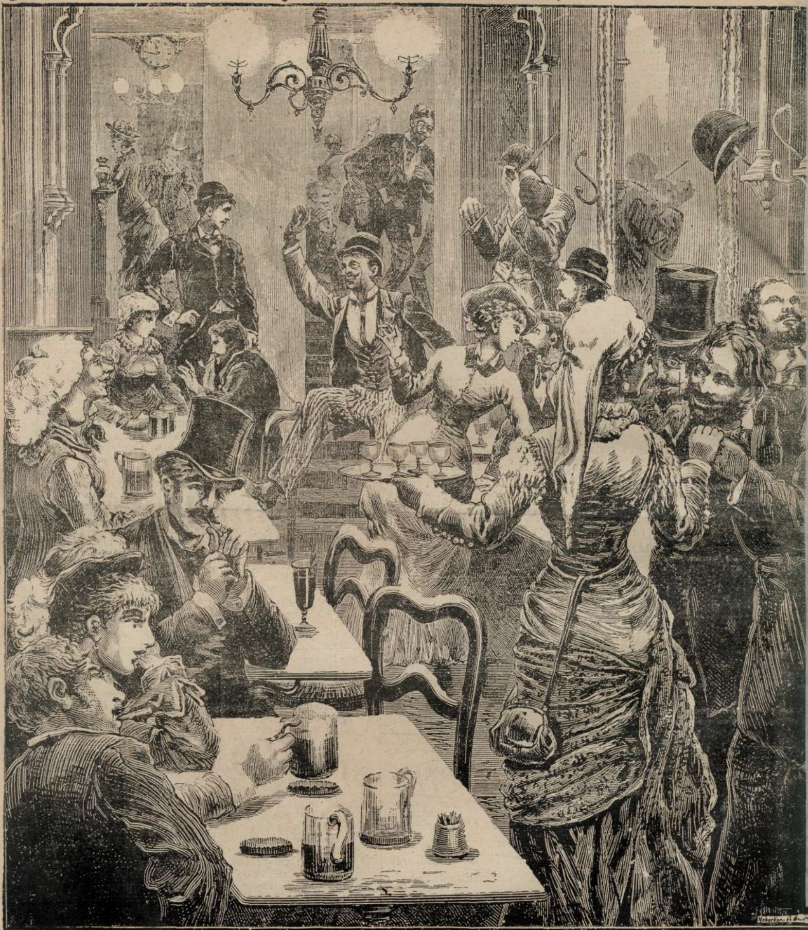
BALŪLU VAGABUNDILORU IN PARIS. I. INAINTE DE MEDIULU NOPTIEL