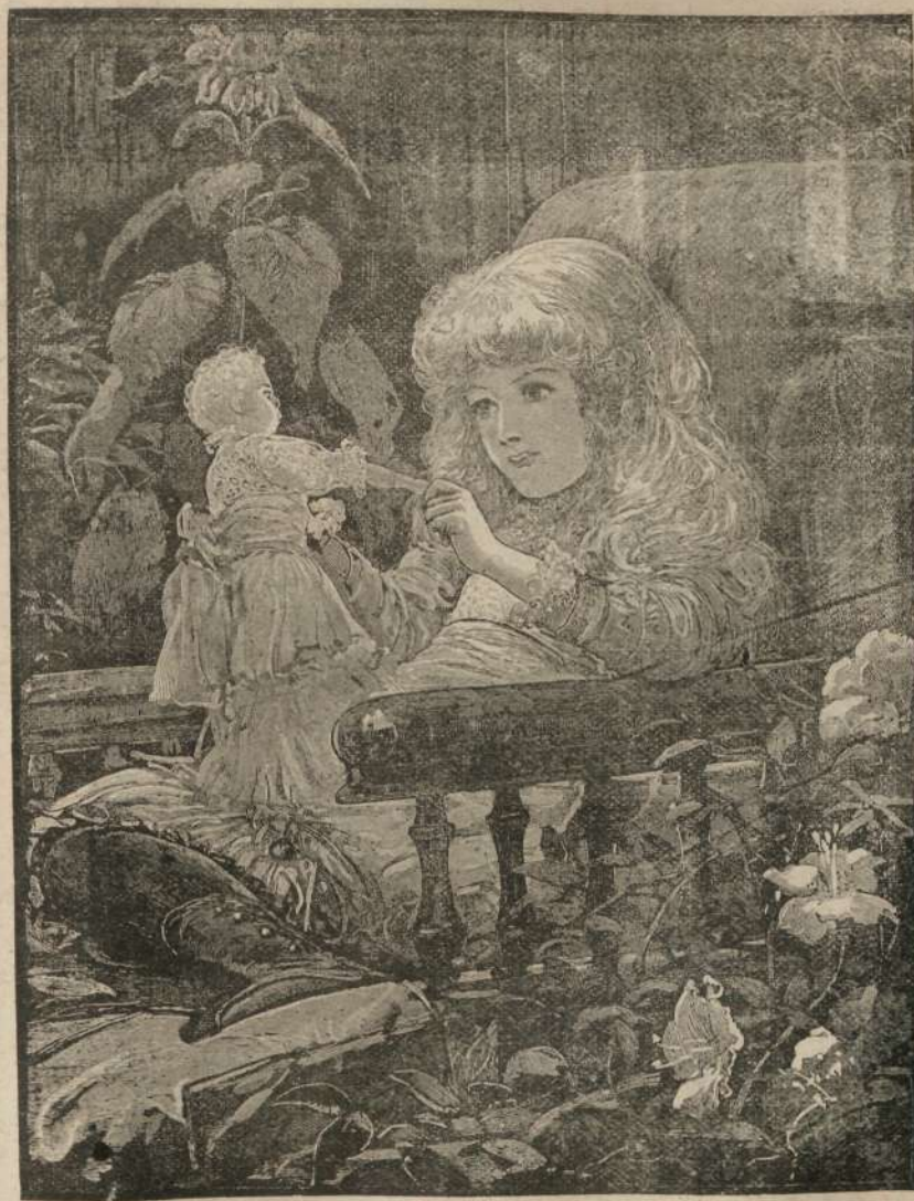
DINTRE BUCURILE COPILARIEI.