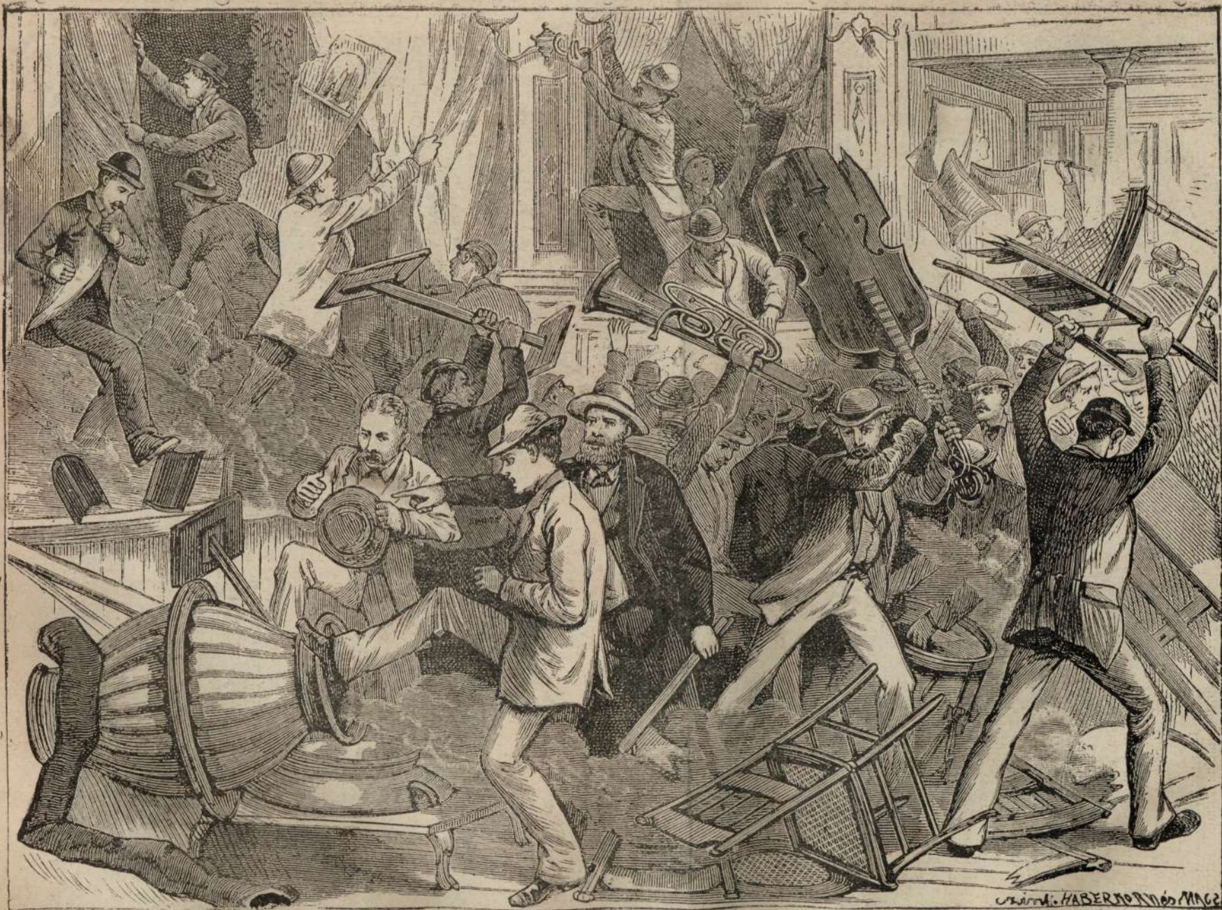
BALULU VAGABUNDILORU IN PARIS. II. DUPA MEDIULU NOPTIEI.