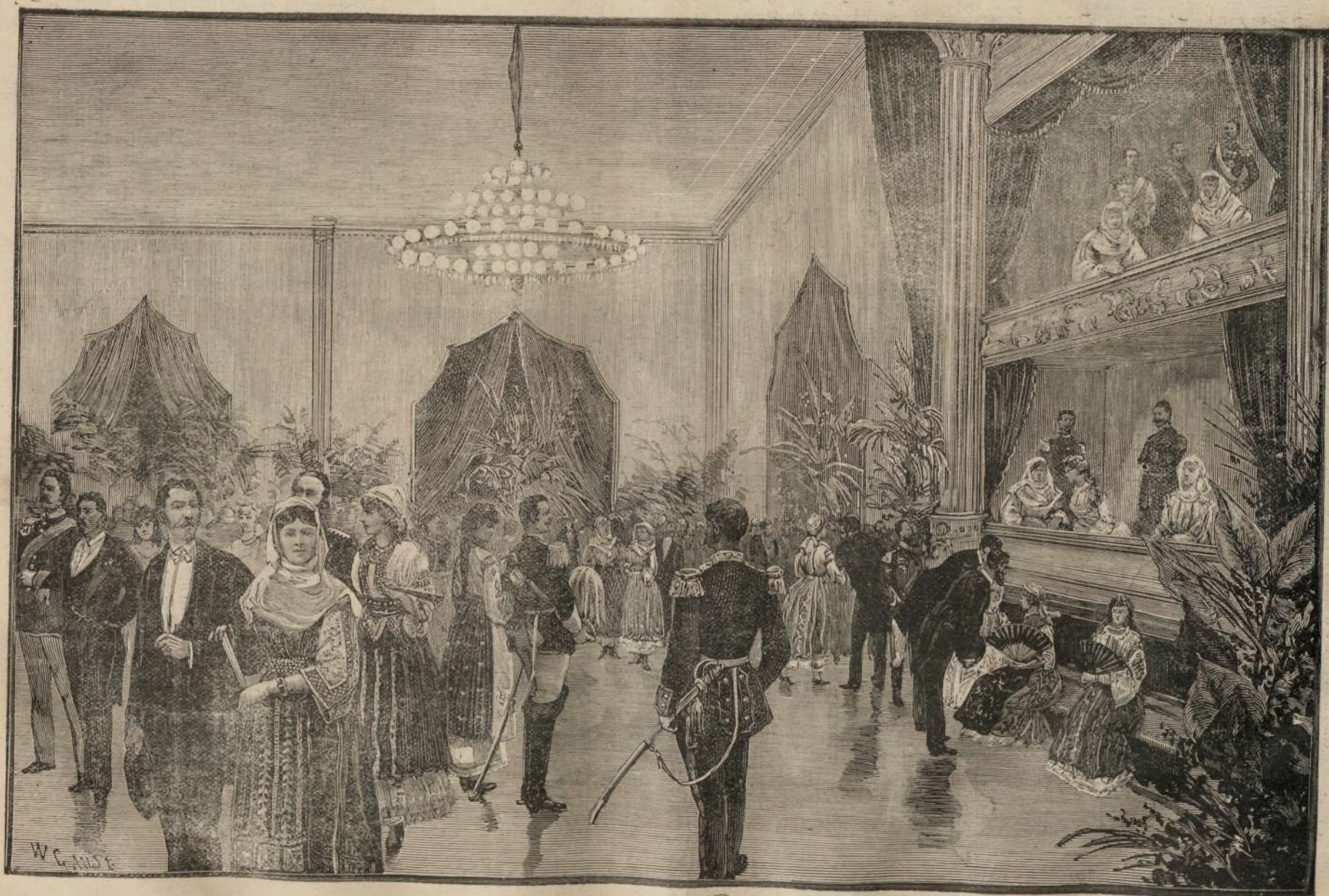
BALU IN SAL'A TEATRULUI, DIN BUCURESCI.