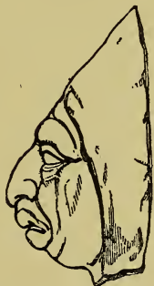
Hunų žiauri išvaizda.

Atsitraukimas Hunų buvo vienas iš baisiausių prietikių, kokius jie kada-nors savo istorijoje buvo patyrę. Jie turėjo grįžti per tas pačias šalis, kurias jie patįs ateidami buvo nupustėję. Tenai buvo kraštai apnuoginti nuo maisto ir visokių reikmenų. Hunai krito, yt lapas, nuo bado ir ligų. Be to, intužę vietiniai gyventojai ant jų užpuldinėjo ir žudė. Vietos buvo nežino-