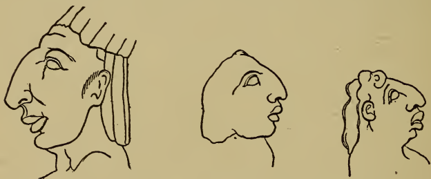
Hunų pavidalai, atrasti Amerikoje.

Užsiduręs ant netikėtos ir gresmingos Romėnų atsparos, Attila nujautė, kad ga- lės įvykti didelis ir kruvinas susirėmimas. Tam tikslui jo tukstančiai skytiškų raite- lių galėjo būti naudingi tiktai ant lygių lau- kų, kur galima užpulti ir vėl išlakstyti. To- del Attila sumuštas Orleane, ryktelėjo į sa-