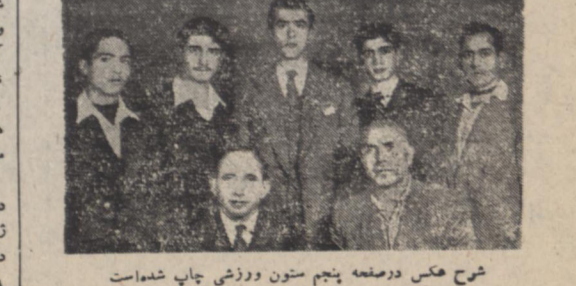
شرح هکس در صحنه پنجم ستون ورزشی چاپ شده است