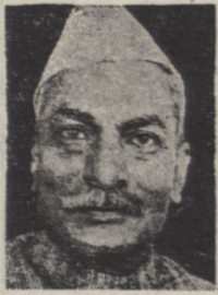
دکتر راجندر پراشاد اولین رئیس جمهوری هند

حالا که خواننده کان عزیز را بقدر امکان در جریان حوادث سالهای اخیر سرزمین صواب کداهم و مختصری از تاریخ هندو میبارزات آزاد بخواند آن ملت را تا بر آورده شدن آزادی مردم در دست آوردن استقلال شرح دادم لازم است از تشکیلات اداری آن کشور قبل از نهضت و بعد از استقلال نیز شمه ای بر سر سران تا آنچه کنونی اداره امور این مملکت و بنا بر روی پرجمیت نیز خواننده کان مستر آگاه شوند. ما بتاریخ قبل از قیام ملی هند و زمانی که انگلیس حاکم این کشور تسلط داشتند و اداره امور را با اختیار گرفته بودند کاری نداریم چه میانه اند. که از سال ۱۸۵۷ میلادی که جنگ بین هند و باقوی نظامی سپانی هند شرقی که قاضی از هند را تحت نفوذ اشغال گرفته بود و قتل بنم کبانی هند شرقی پایان یافت ملکه و بکتوریا خود را ملکه انگلیس و هند خواند و تمام خاک هند جزء امپراطوری انگلیس اعلام گردید و سازمانهای شور تقریباً بر اساس تشکیلات کشور انگلستان در آمدن این وضع ادامه داشت تا سال ۱۹۱۹ یعنی مونی که در آنجا زیر بار جنگ بین المللی اول بیرون آمدن بود و قیام نهضت آزاد بخواند ملت هند تحت رهبری کلمنی پشت