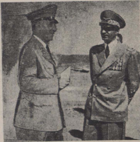
اهلیحضرت همایونی قبل از عزیمت بشهد در فرودگاه مهرآباد در اتنا مذاکره با آقای نخست وزیر دیده میشوند

میکویند ایرانی مقلد خوبی است آنچه را در دنیا بیند و از دنیا میبندد زود تقلید میکند ولی میدانم چرا این احساسات پیوسته بسوی بدیها و مفاسد معطوف میشود و خوبیهای ملل عالم را از یاد میبرد و تقلید نمیکند. چراغها را زنده کردیم مردم خوشگذران و هیاهو اروپائی که در هر میلیون پنج مگرم اینطور پیدا میشوند زود درین ما متمسک و تقلید میشود، اما حقیقت زندگی ساده و بی آرایش میباید بود که توده حقیقی ملت را تشکیل میدهد از نظر فراموش میشود. از مد لباس زود الگو برداشته میشود، اما سادگی لباس و صرفه جویی و بی تکلفی و بی قیدی خانواده ها در پوشیدن لباس مورد توجه واقع نمیکرد. زهدی لوکس و تجمل را روی پرده های سینما می بینیم و تصور می کنیم حقیقت زندگی همین است و بسراغ تقلید از آن زندگی میرویم در صورتیکه اغلب متوجه نیستیم که این صحنه های مصنوعی برای سرگرمی و جلب توجه مردم تهیه