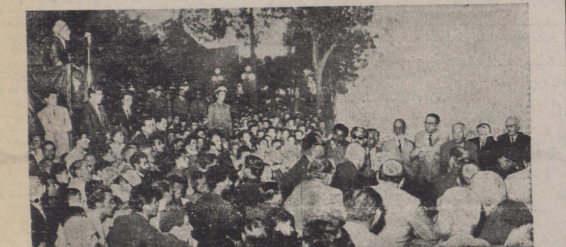
عکس بالا از مجلس عزاداری حضرت خاامس آلها در کاخ گلستان هنگامی که جمعی از رجال و محترمین و نمایندگان سیاسی کشور های اسلامی و طبقات مختلف مردم مشغول استماع موعظه آقای فلسفی میباشند برداشته شده است