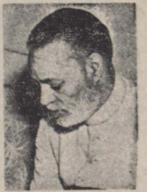
ظفر الله خان

بیروت - خبرگزاری فرانسه - ظفر الله خان وزیر امور خارجه پاکستان پس از شرکت در اولین جلسات مجمع عمومی سازمان ملل متحد و ایراد نطق همی علیه فرانسه با هوایا از بیروت پس از سفری که در آنجا به سرانجام رسانیده و در بیروت چند ساعت توقف نمود و در طی یک کنفرانس مطبوعاتی در این شهر طرز کار و روش دول عرب آسیائی را در سازمان ملل یعنی اتحاد کرد. ظفر الله خان دول عرب آسیائی را از این که سیاست خود را پایکدیکر و غف نیده و پس از اینکه در مقابل عمل ایجاب شده ای قرار گرفتند بلکه چاره می یافتند بختی مذمت کرد. ظفر الله خان اظهار داشت که شایسته آن است که دول گاه پس از ۲۴ ساعت در این دهانه یعنی از دول در افروشی می کنند و علاوه کرد که هم اتحاد و مقاومت دول عرب آسیائی باعث این شده که دول بزرگ نفوذ و تاثیر آنرا در سیاست بین المللی ناده بگیری. ظفر الله خان سپس با بحث بروی میز کوید و گفت دول عرب امروزی هوالی که در ۱۹۴۷ تقسیم فلسطین دای واده اندیش از پاکستان که در آن تاریخ از دول عرب پشتیبانی کرده روابط دوستانه و نزدیک برقرار کرده اند.