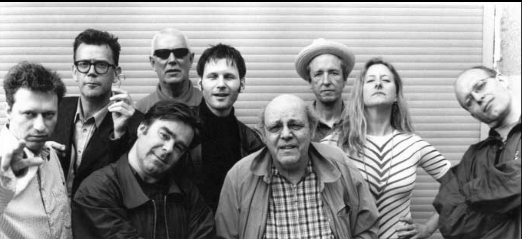
Het ICP Orkest