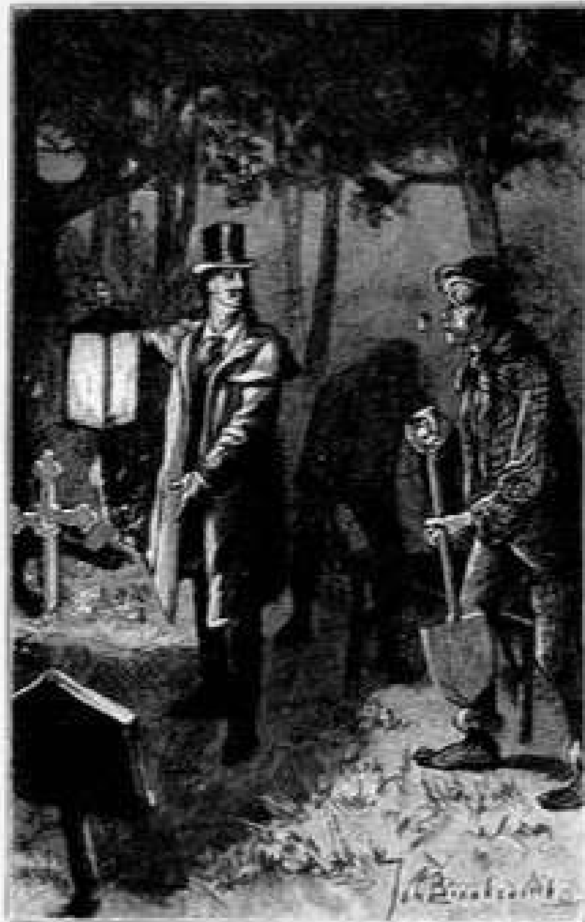
„Hier is het,” zeide de jonge dokter Robinson en hielde de lantaarn op.