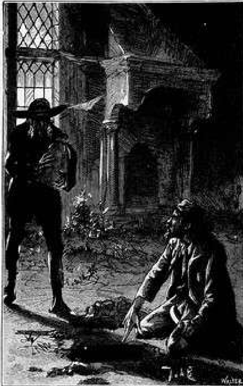
„Man, het is gold!“