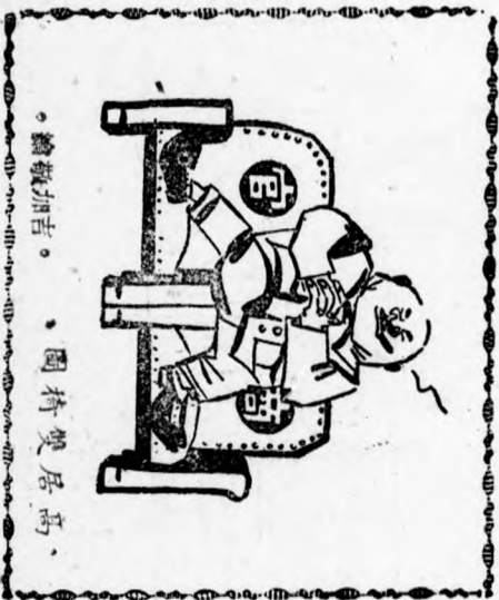
• 繪技加吉 • 圖持雙居高