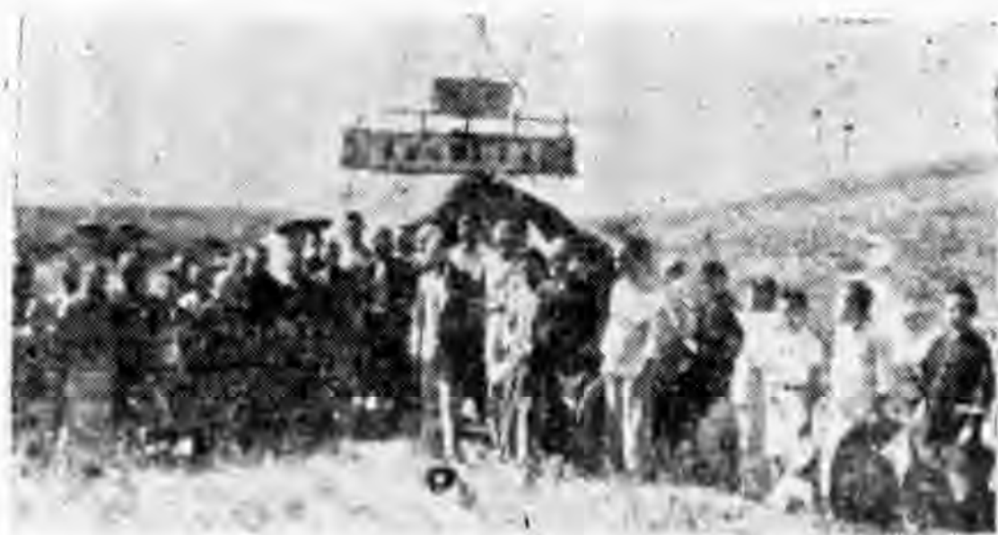
凌署長親臨上社鄉建築塘工與該鄉紳之合影 (有者爲署長)

查農民銀行貸款月息三分半，分兩期清還，第一期本年秋季收爲還款三百萬元，明年春收後還款三百萬元，查此貯水塘長約十八丈，面積瀾二丈高十五丈，底瀾五