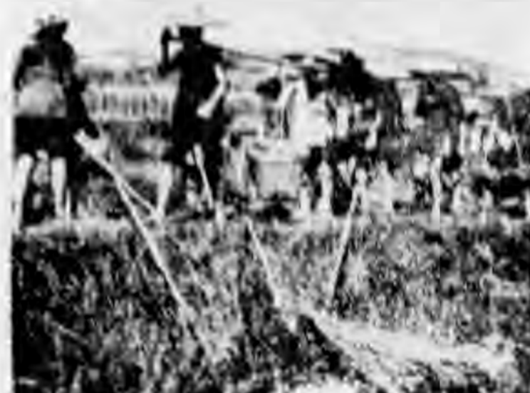
番禹棠上下社鄉築塘施工情形之二